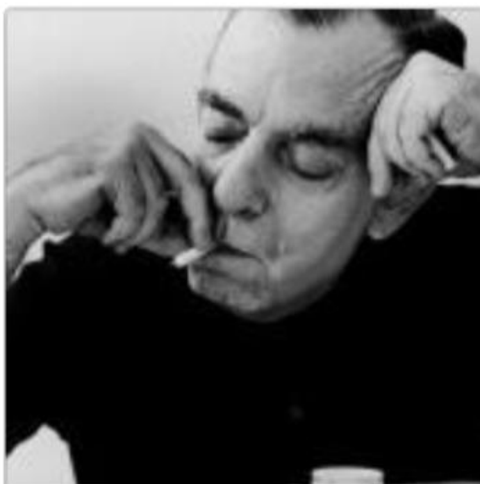
Rádio Universitária FM 107,9 –