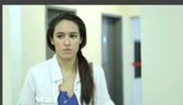
"Mais uma história de amor sem título" (2014), de Grenda Lisley