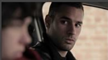
"Cabine Telefonica" (2013), de Luciana Vieira