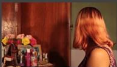
"Tenho um Dragão que Mora Comigo" (2014), de Wislan Esmeraldo