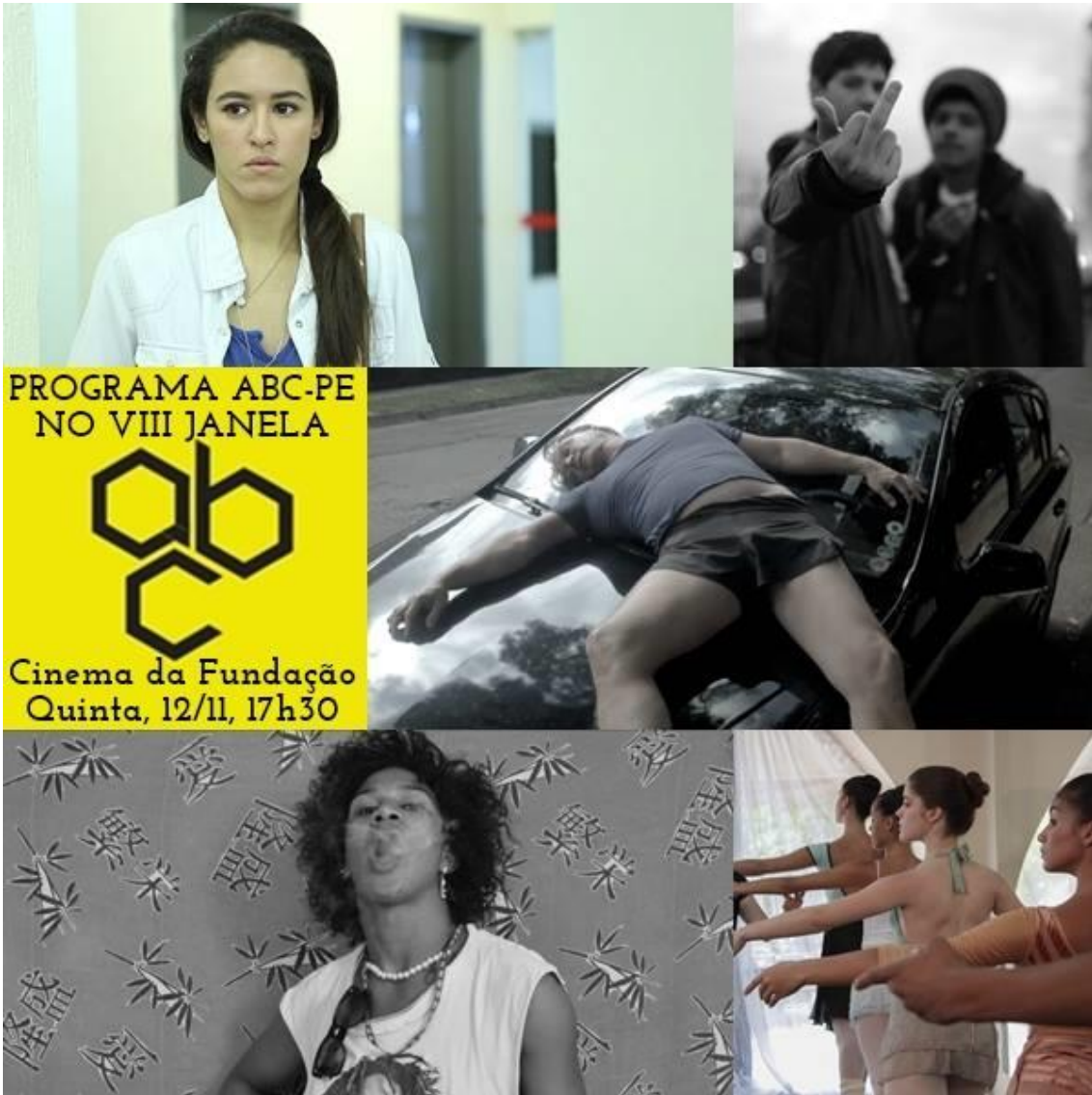
Exibição de “Mais uma história de amor sem título” no programa ABC-PE, integrante do VIII Janela Internacional de Cinema