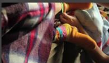
"Curitiba" (2013), de Víctor Costa Lopes