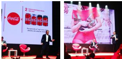
( https://www.instagram.com/p/BP0A1v5f7m/ )

@oestadoonline Você jamais será livre sem uma imprensa livre. Confira o seu portal de notícias: ( http://instagram.com/oestadoonline )