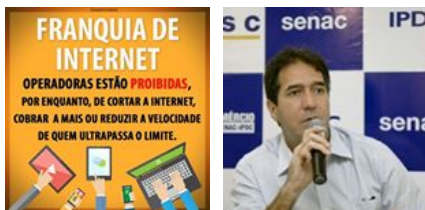
( https://www.instagram.com/p/BPI7br6AyPZ/ )