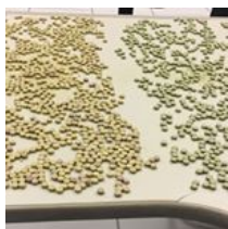
( https://www.instagram.com/p/BPGaqefgngf/ )