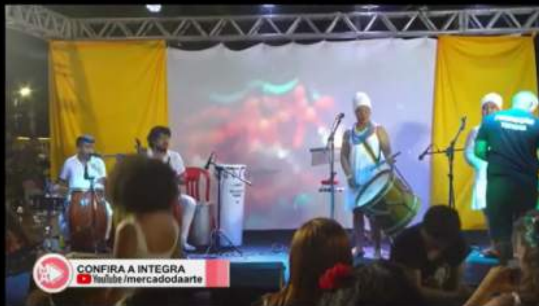
TV CEARÁ - 20 ANOS CARAVANA CULTURAL.mp4