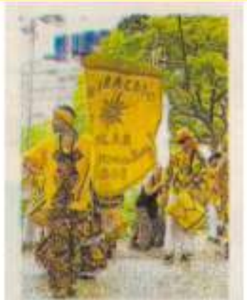
• Jornal O Povo - Caderno 01 - Sessão Cotidiano (Destaque) - 06/Fev./2017 - Fortaleza - CE

PERCUSSÃO. Realizada pela Caravana Cultural desde 2001, em parceria com o grupo Cã dos Santos, a Bial de Percussão - Encontro Estadual de Percussão realiza sua nona edição com uma extensa programação gratuita até domingo, 18, em três locais da Cidade: Centro Dragão do Mar de Arte e Cultura (Rua Dragão do Mar, 81 - Praia de Iracema), Sesc-Iracema (Rua Boris, 90 C - Praia de Iracema) e Batukaya Geral (Rua dos Tabajaras, 374 - Praia de Iracema). Os destaques de hoje, 16, a partir das 18 horas, no Espaço Rogaciano Leite Filho, são um cortejo reunindo os Batuqueiros da Caravana, Maracatu Solar (foto) e Maracatu Vozes d'África, seguido do Batuque Orquestra Solar de Tambores e Descartes Gadelha, e Caravana Cultural. Outras info: 9 8818 3113.