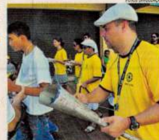
A Bienal Percussiva 2016 será lançada durante o evento

VII Fortaleza Liberta - Especial Encontro da Cena da Cultura Tradicional e Popular Negra de Fortaleza Quando: hoje, 13, das 16 às 22h Onde: auditório e Espaço Mix do Centro Dragão do Mar de Arte e Cultura (Praia de Iracema) Programação gratuita Outras info: no endereço www.letraviva.com.br