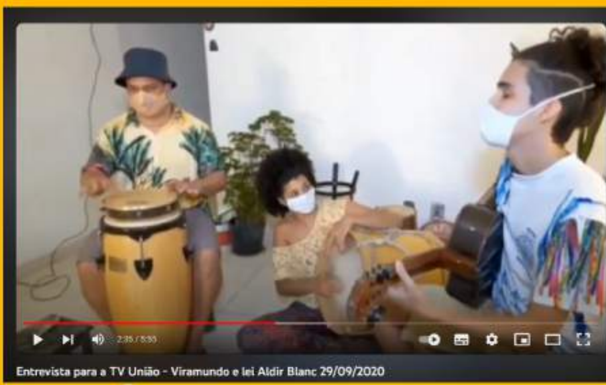
Entrevista para a TV União - Viramundo e lei Aldir Blanc 29/09/2020