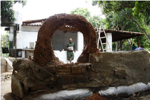
Construção de forno bio-construído

O ano de 2011 foi consagrado à reforma do espaço porém contou com oficinas de permacultura, construção de um muro de superadobe, plantação de árvores e flores no espaço.