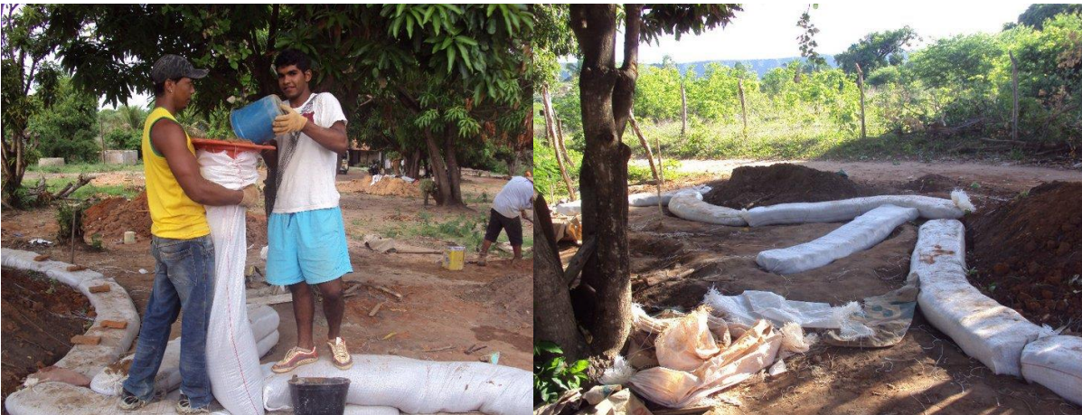
Construção de muro de superadobe