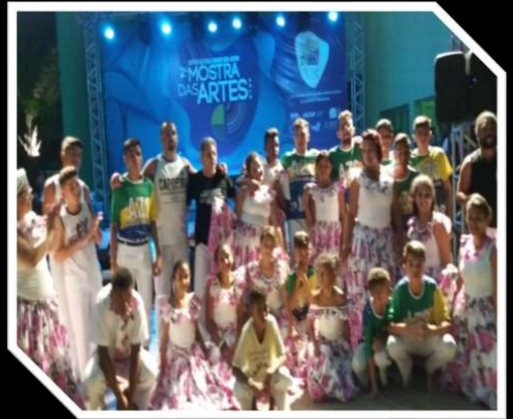
Apresentação de capoeira e samba de roda na 2ª Mostra das Artes CCBJ - 2019

EDUCAÇÃO E PESQUISA: formação continuada em educação para a paz e produção de pesquisas sobre a capoeira e Cultura de Paz e as danças afroreferenciadas (jongo, coco, samba, tambor de crioula).