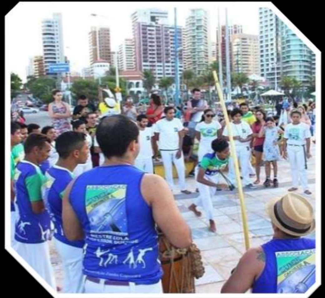
Apresentação de Capoeira: Calçadão da Praia de Iracema - 2019

A instituição funciona como núcleo de formação humana continuada centrada na arte e cultura como elemento de transformação e desenvolvimento humano.