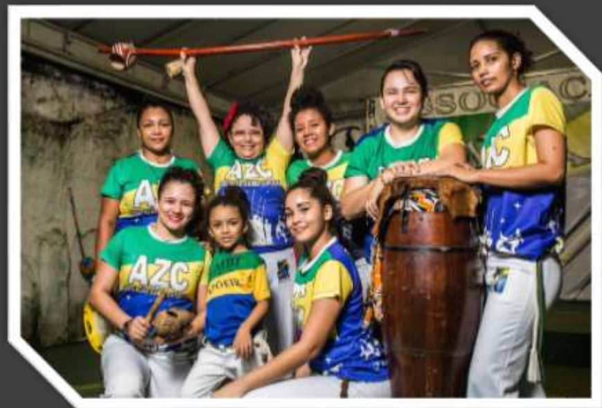
APRESENTAÇÕES DE MACULELÊ, CAPOEIRA E AFOXÉ - 2019