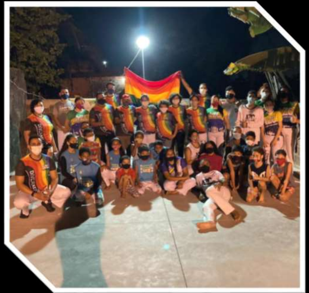
Coletivo Diversidade AZC - 2023

Coletivo Diversidade AZC (discussão do tema LGBTQIPN+ dentro da capoeira e de forma geral e seus devidos encaminhamentos..)