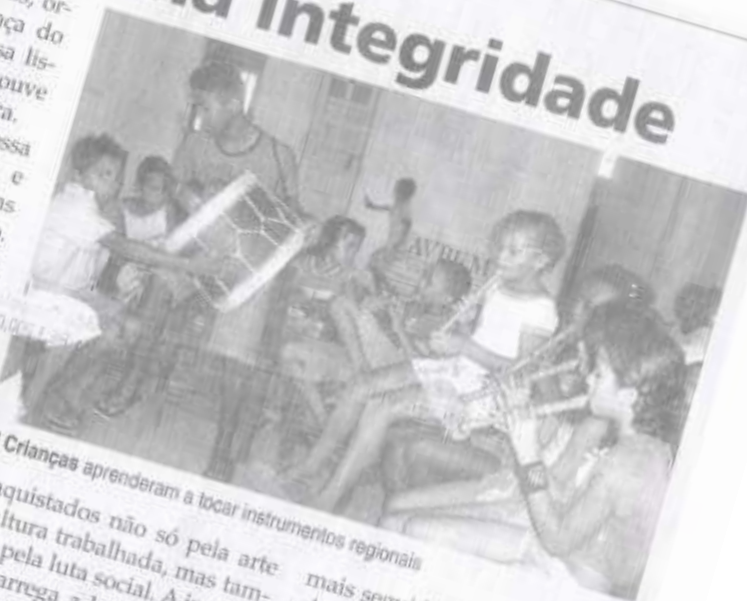
■ Crianças aprenderam a tocar instrumentos regionais