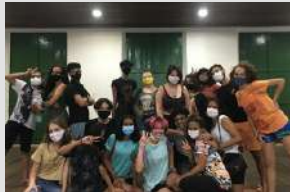
Curso Livre de Teatro (Turma B: Adolescentes – 13 a 16 anos) - 2022