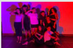
Laboratório de Criação I - janeiro a julho de 2022 Criação: "Experimento Z"