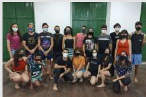
Curso Livre de Teatro (Turma C: Jovens e Adultos – a partir de 17 anos) - 2022