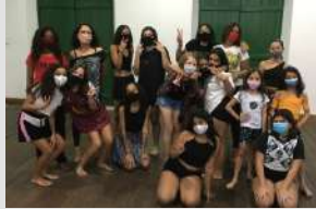
Curso Livre de Teatro (Turma A: Crianças – 8 a 12 anos) - 2022