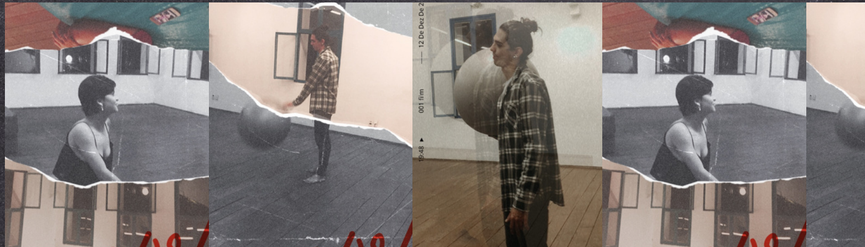
Imagem divulgação da série "møvement"

Os vídeos nascem com o objetivo de aproximar o público das redes sociais dos processos de gravação, criação e desenvolvimento dos trabalhos desenvolvidos pelo grupo. Os lançamentos acontecem simultaneamente no IGTV e canal no Youtube do projeto.