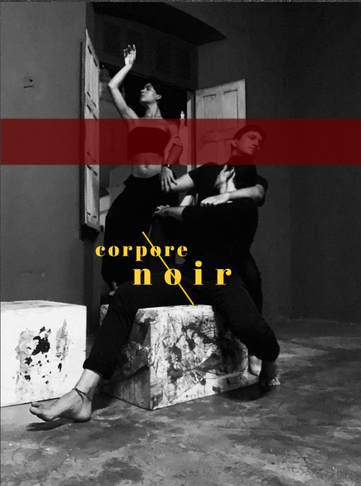
Imagem divulgação do vídeo performance "noir"