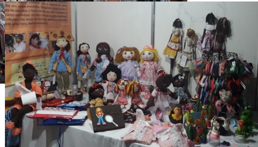
Dragão Fashion, FENACCE, etc.