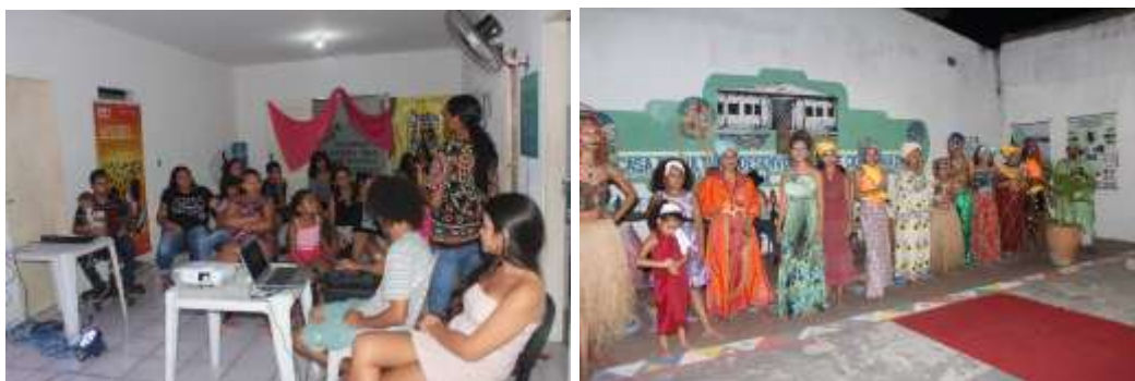
Lançamento do projeto EMPA – Evento Ubuntu - desfile Afro Fashion 2017