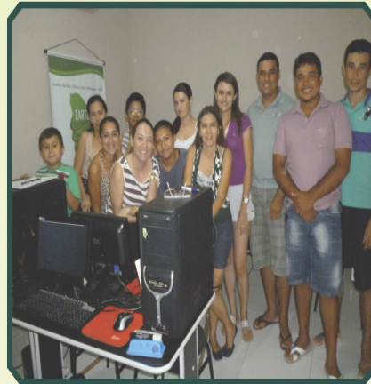
Laboratório do IARTE