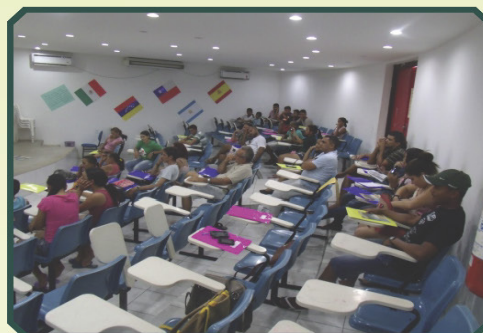
9º Encontro Municipal de Jovens Rurais