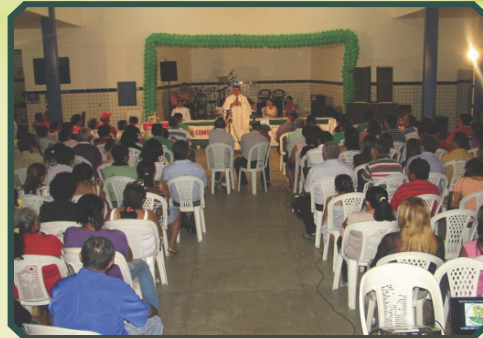
50 anos do Sindicato dos Trabalhadores e Trabalhadoras Rurais de Quixeramobim