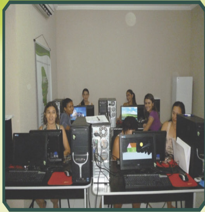
Laboratório do IARTE