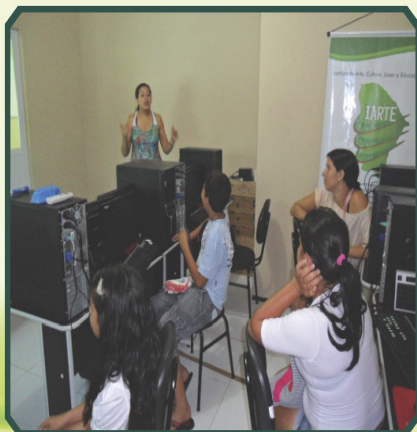
Laboratório do IARTE