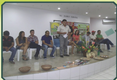
9º Encontro Municipal de Jovens Rurais