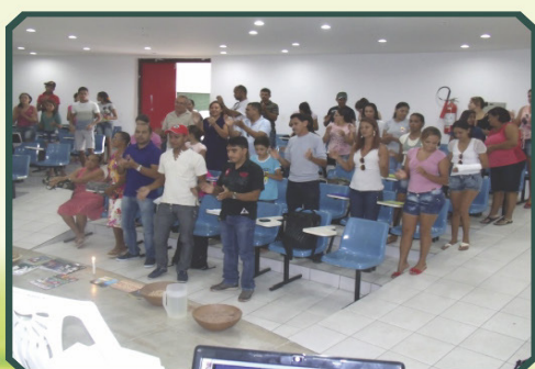
9º Encontro Municipal de Jovens Rurais