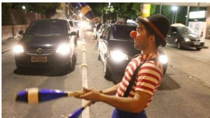
Iniciativas mantêm a arte circense em Fortaleza

Desde a década de 1970, a data de nascimento do lendário palhaço Piolin (1897-1973) é celebrada como o Dia Nacional do Circo. Do modelo de famílias tradicionais itinerantes vivenciado pelo paulista de nome de batismo Abelardo Pinto até hoje, a linguagem artística viveu intensas ampliações. A arte de lona permanece viva, mas o circo se expandiu, conquistou outros espaços e fomentou transversalidades com o teatro e a dança. Aqui em Fortaleza, iniciativas de artistas têm conseguido movimentar o cenário e criar experiências formativas.