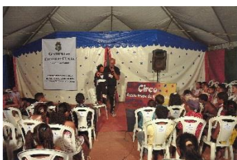
Editais de Incentivo as artes: Circo 2016