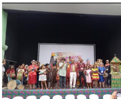
Participação na 4ª Conferencia Municipal de cultura

PROPONENTE CONTEMPLADA NO XII EDITAL DE INCENTIVO AS ARTE 2022 – TETRO DE BONECOS- MONTAGEM E CIRCULAÇÃO- AS PERIPECIAS DE JOAO REMEXE O BUCHO E O PRINCIPE RIBAMAR, PARA SER DOIDO É PRECISO TER JUIZO.