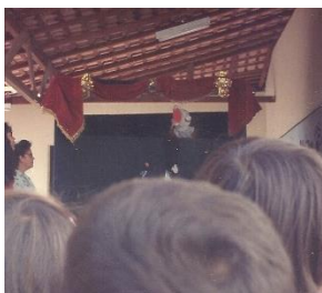
Escolas em SANTA INES -MA 1997.