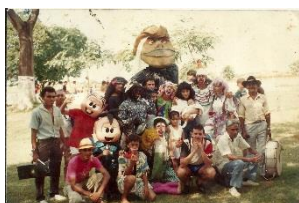
AABB Juazeiro do Norte 1992.