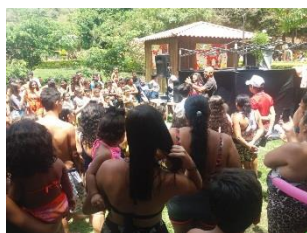
Férias no Caldas 2118