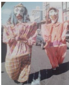
Bonecos gigantes, Cortejo – Juazeiro 1993