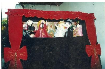
Projeto: Cordel Encantado. Stenio Diniz 2001