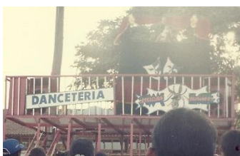
Projeto Trenzinho da História. Para- Brasil 1997