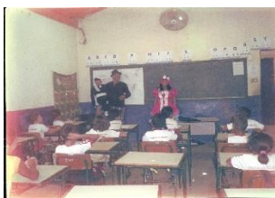
Projeto: Incentivo as provinhas do ISPAECE 2014