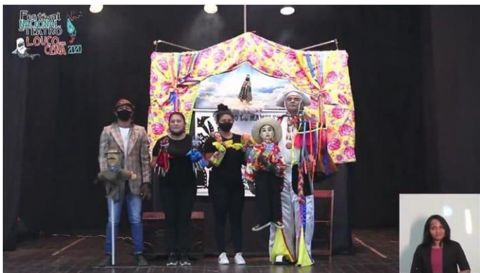
Festival Louco em cena -2020