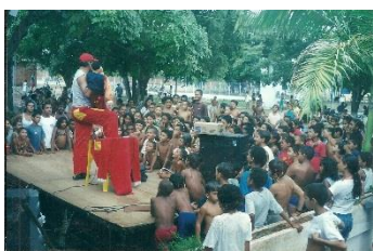
Projeto: Colônia de Férias da Escola Viva 2002