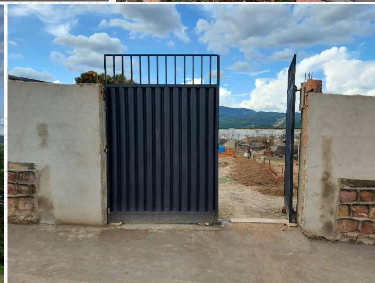
Imagens da construção da nova sede da Associação PROCEM no Seminário: jan. a junho/2021.