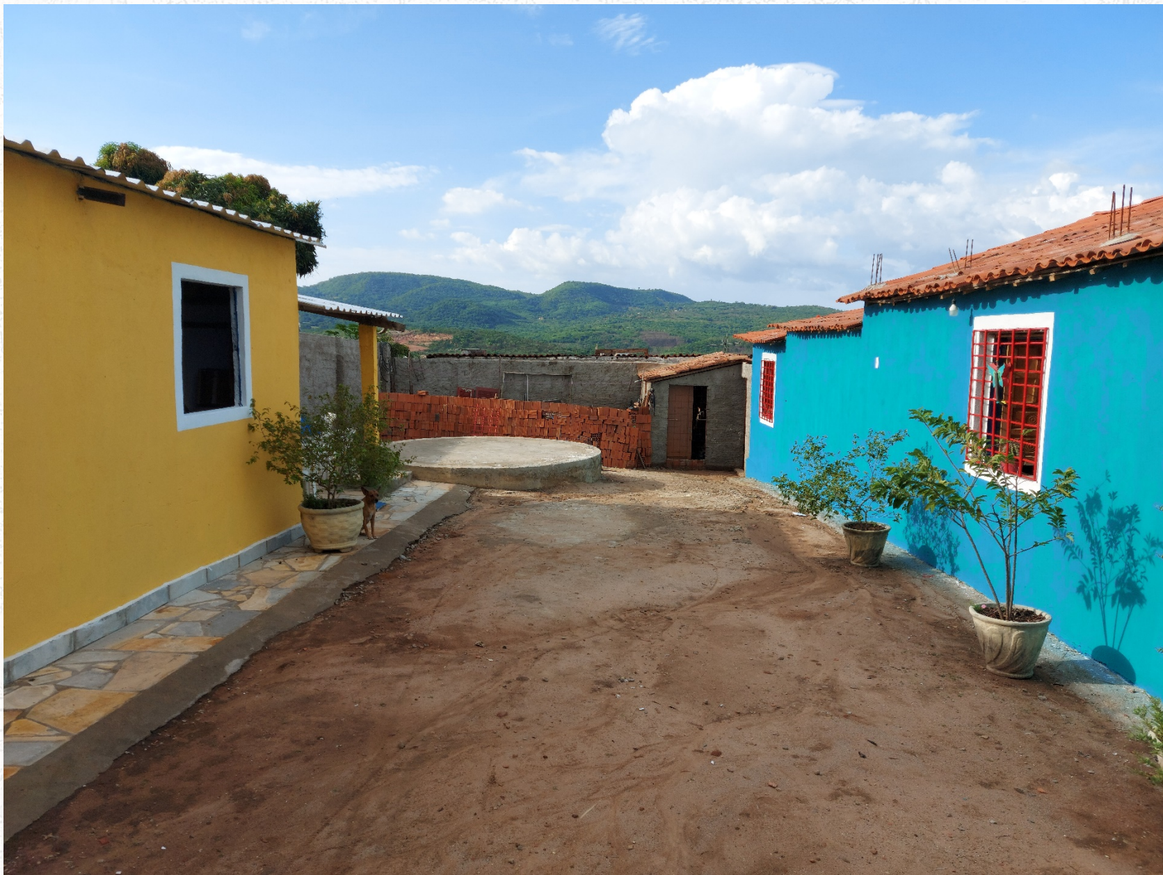
Imagem do terreiro da nova sede do Ponto de Cultura PROCEM/Coletivo Cultural Casa Luz: Janeiro de 2022.