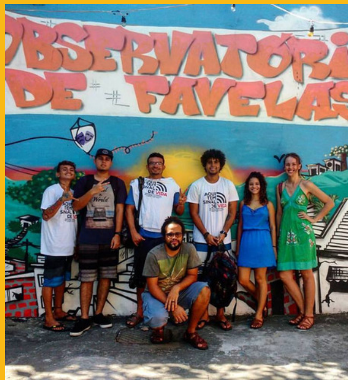
Visita ao observatório de favelas no complexo da Maré