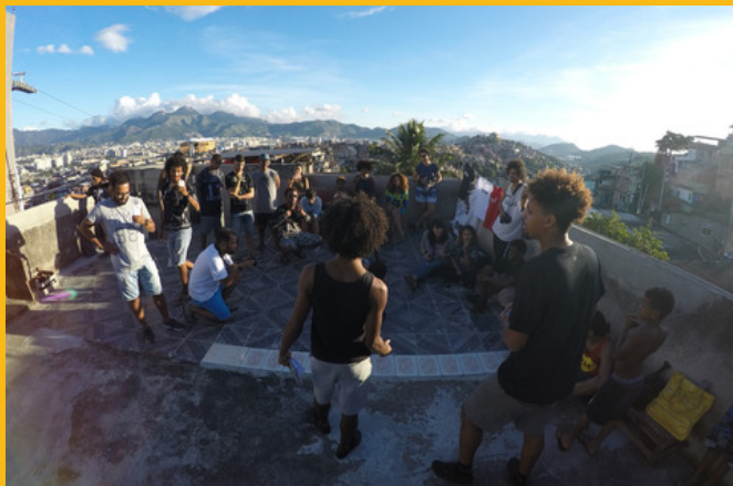
Slam Laje - 1ª Batalha de poesia do complexo do alemão