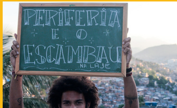
Sarau - Periferia e o Escambau / Complexo do Alemão