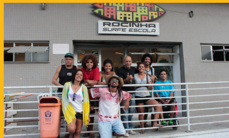
Visita a escolinha de surf da Rocinha