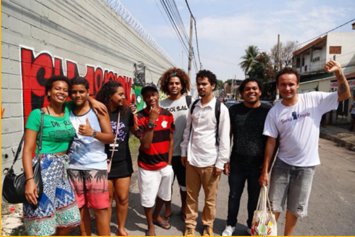
Movimente-se encontro nacional que durou três dias, com 40 jovens de várias favelas e periferias do Brasil para pensar propostas concretas para mudar as políticas de drogas.