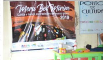
Oficina de confecção de máscaras, ritos e toadas do reisado – Sede da Associação Comunitária São José – ACSJ, Ponto de Cultura