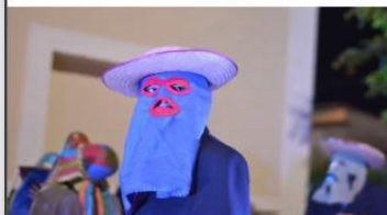
Apresentação na I Mostra Natalina de Palestina do Norte 2019