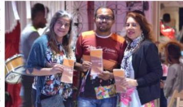
Distribuição de folders informativos do projeto - Apresentação no VII Natal Solidário da Comunidade São Vicente 2019