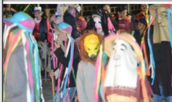
Participação das crianças - Apresentação no II Alto de Natal do Ponto de Cultura, Sítio Recife 2019

A folia de Reis, Reisado, ou Festa de Santos Reis é uma manifestação cultural religiosa festiva, classificada no Brasil como folclore praticada pelos adeptos e simpatizantes do catolicismo com o intuito de rememorar a atitude dos Três Reis Magos — que partiram em uma jornada à procura do esconderijo do Prometido Messias (O Menino Jesus Cristo), para prestar-lhe homenagens e dar-lhe presentes.