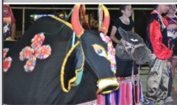
Apresentação no II Alto de Natal do Ponto de Cultura -Sítio Recife 2019