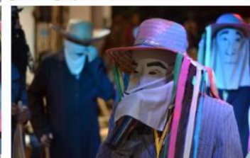
Apresentação no VII Natal Solidário da Comunidade São Vicente 2019