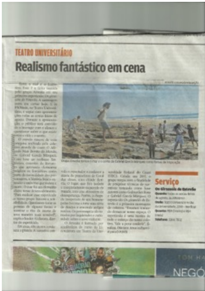
Matéria de divulgação no caderno de Cultura do Jornal O Povo.