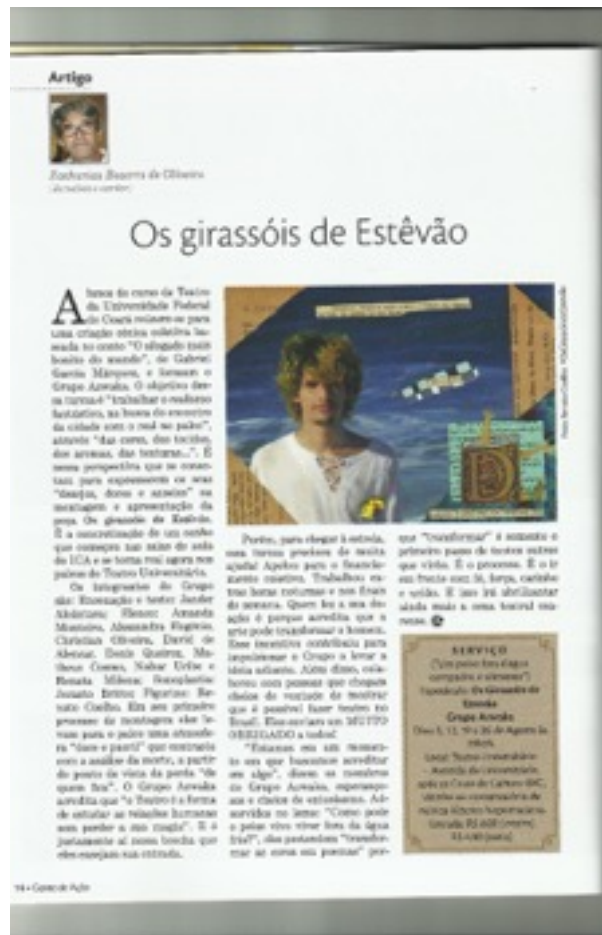
Matéria de divulgação da estreia do espetáculo circulado na revista Gente de Ação.