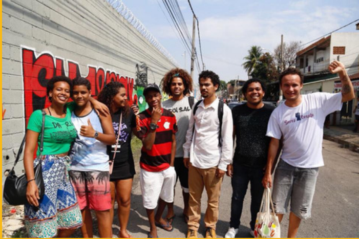
Movimente-se encontro nacional que durou três dias, com 40 jovens de várias favelas e periferias do Brasil para pensar propostas concretas para mudar as políticas de drogas.