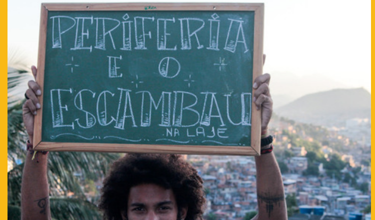
Sarau - Periferia e o Escambau / Complexo do Alemão