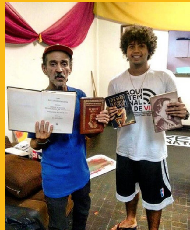
Hospedagem no Hotel e spa da loucura, situado no Hospital Psiquiátrico Nise da Silveira