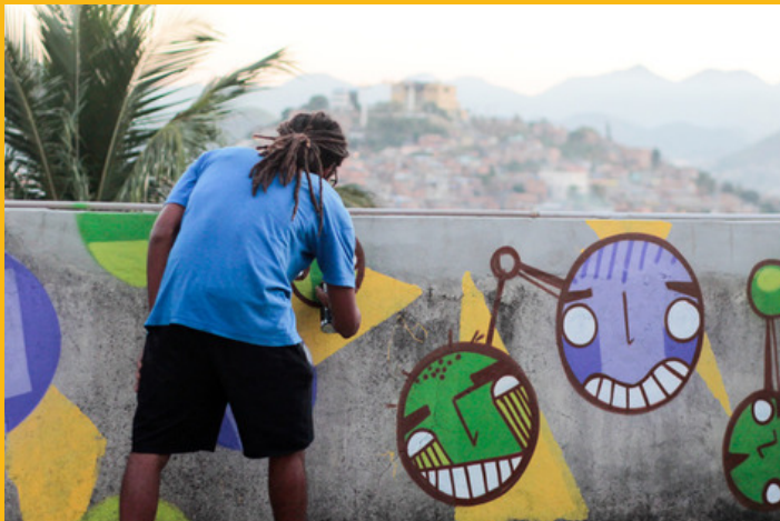
Spot, intervenção de graffit na laje da casa brota