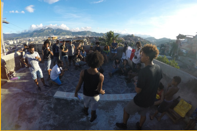
Slam Laje - 1ª Batalha de poesia do complexo do alemão