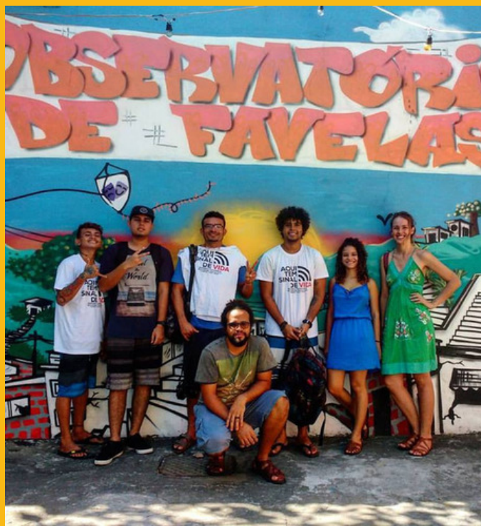
Visita ao observatório de favelas no complexo da Maré