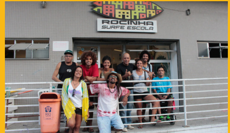
Visita a escolinha de surf da Rocinha