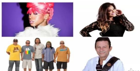
Rapper Karol Conka, a cantora Kátia Cilene, a banda de reggae Tribo de Jah e Aldo Sena estão entre as atrações musicais do festival Maloca Dragão.

O Centro Dragão do Mar de Arte e Cultura, na Praia de Iracema, recebe de 25 a 30 de abril, a quarta edição do festival Maloca Dragão. Este ano, o evento contará com 130 atrações cearenses, nacionais e internacionais, em 24 espaços do Dragão e Praia de Iracema, em Fortaleza. O festival será aberto nesta terça-feira (25), às 19 horas, com a exposição "O fotógrafo Chico Albuquerque, 100 anos", no Museu de Arte Contemporânea do Ceará (MAC- CE).