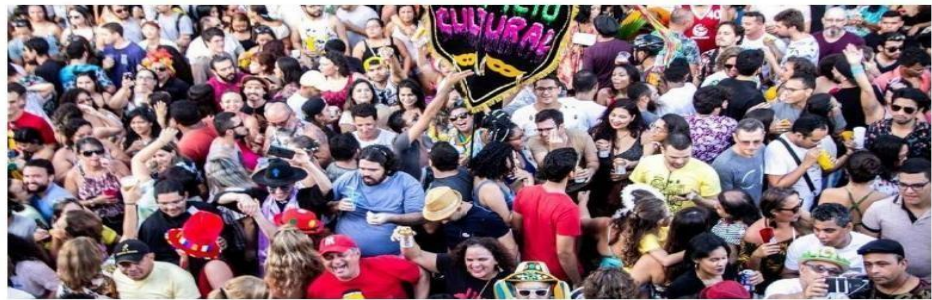
Bloco Hospício Cultural