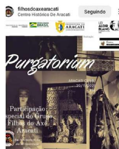
1 curtidas filhosdoaxearacati É hoje! As 19hrs, local Aracati lube. Sinta-se convidadx. 🍷🍷🍷 7 de novembro de 2021 • Ver tradução