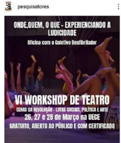
Curtido por fulopequena e outras 245 pessoas pesquisadores INSCRIÇÕES LIBERADAS no perfil. 🙌 /indes diretamente da terra linda de Aracati, para ser indes e potentes em nosso evento!