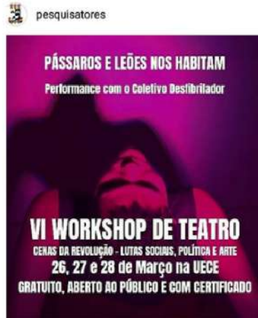
Curtido por fulopequena e outras 245 pessoas pesquisadores INSCRIÇÕES LIBERADAS no perfil. 🙌 /indes diretamente da terra linda de Aracati, para ser indes e potentes em nosso evento!