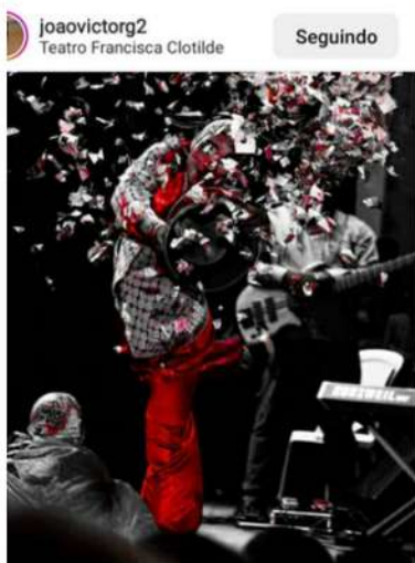
curtidas joavictorg2 De uma noite pra lá de especial. .