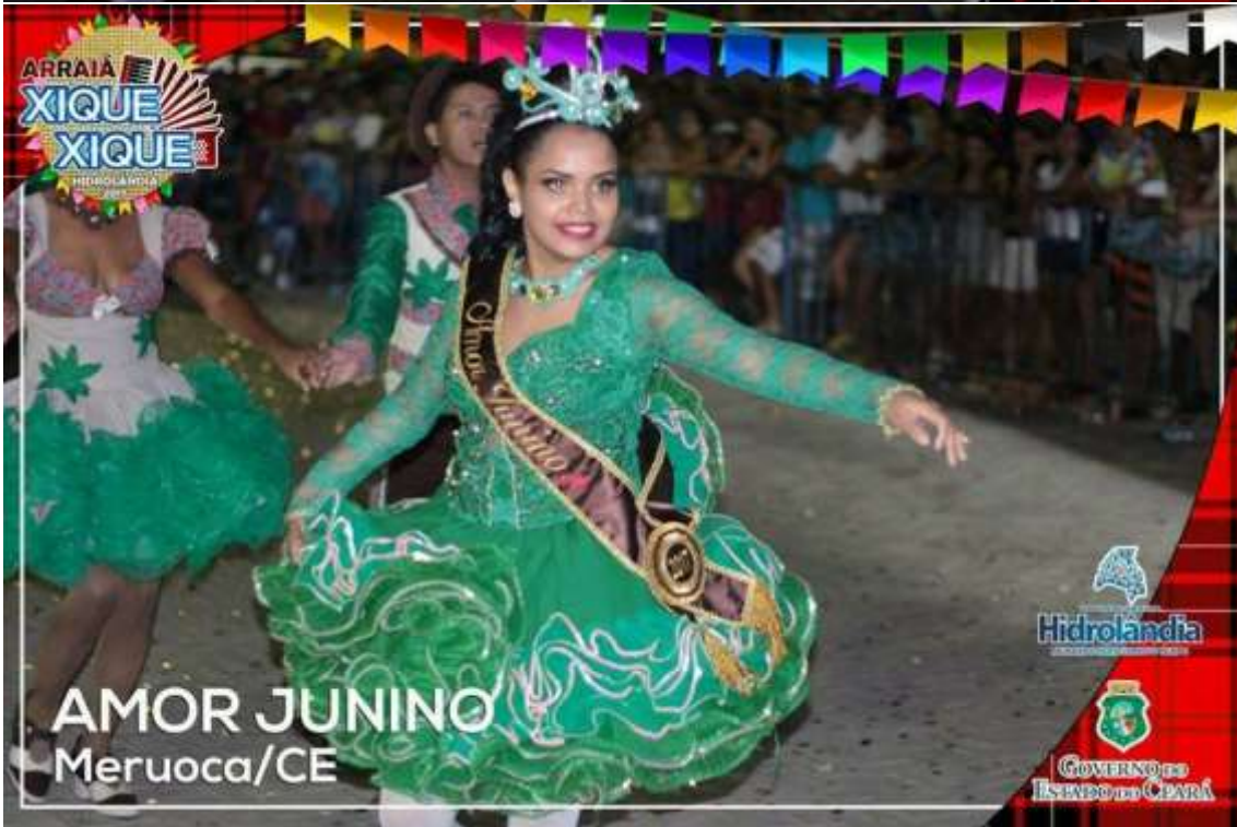
AMOR JUNINO Meruoca/CE