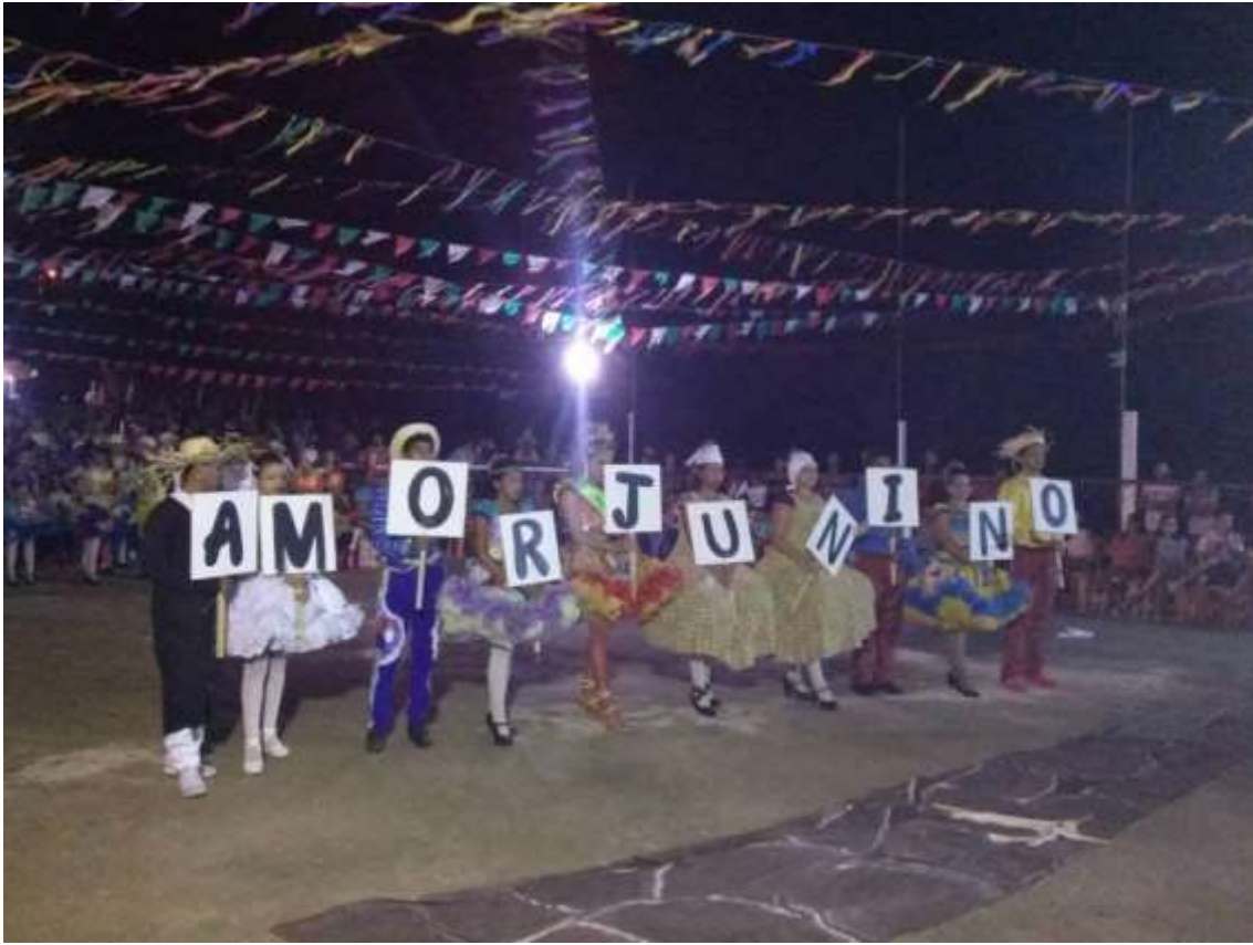
FESTIVAL: ARRAIÁ XIQUE- XIQUE EM HIDROLÂNDIA 2015