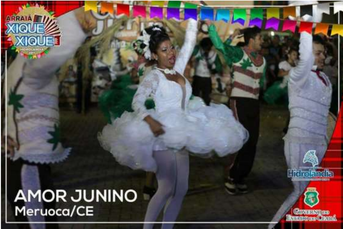
AMOR JUNINO Meruoca/CE