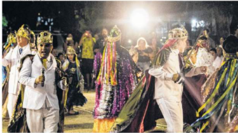
Brincantes Cordeão do Carvão se apresentam na Ritoria