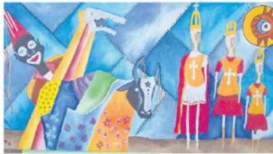
Obra de exposição Reisado: Tradição em Telas , de Arnaldo Moura