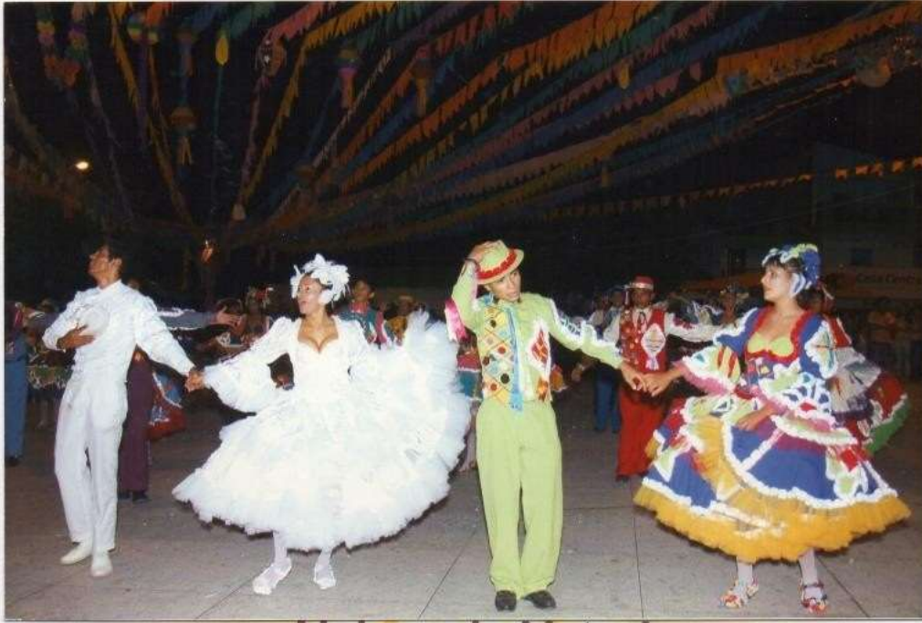
Noivos do Xote A