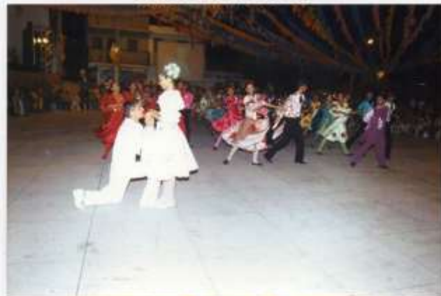
Meu Xodó - Ipueiras