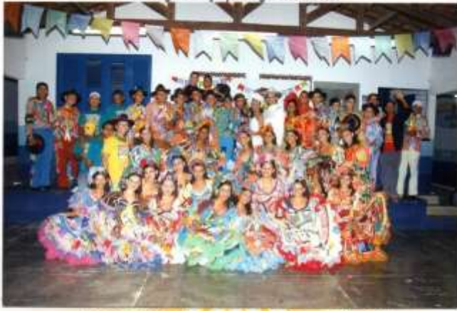
Coordenadores Da Flôr e Prefeita

Traz a alegria e emoção para alegrar esse São João