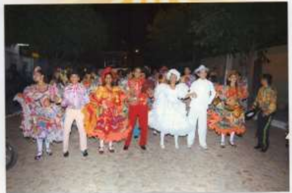
Flor de Coroatá na Praça da liberdade