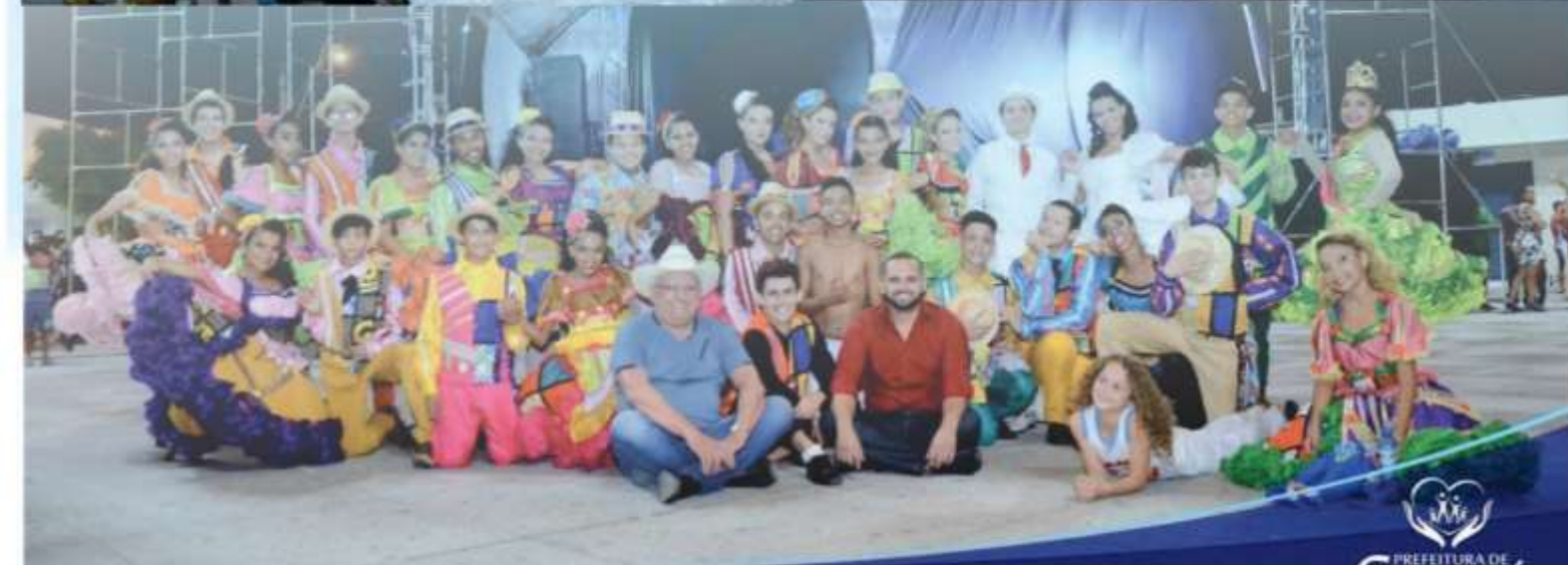
FESTIVAL CULTURAL DE CROATÁ