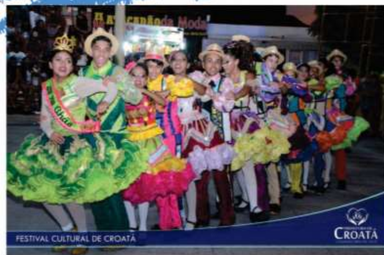
FESTIVAL CULTURAL DE CROATÁ