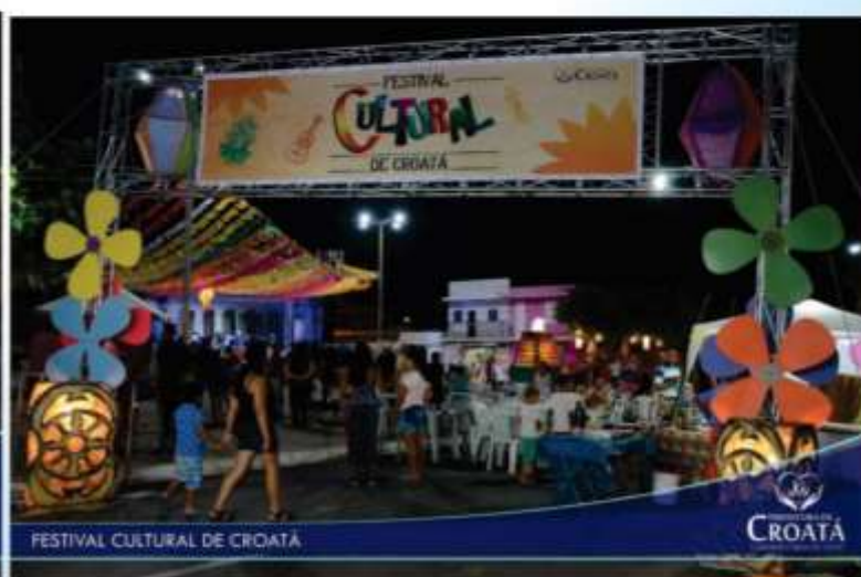
FESTIVAL CULTURAL DE CROATÁ