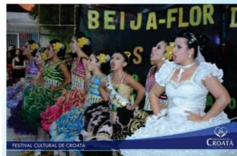
FESTIVAL CULTURAL DE CROATÁ