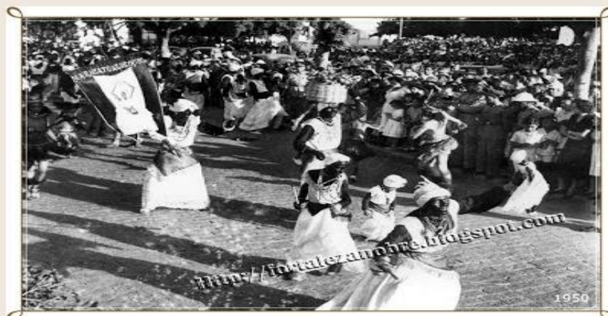
Maracatu Az de Ouro em 1950