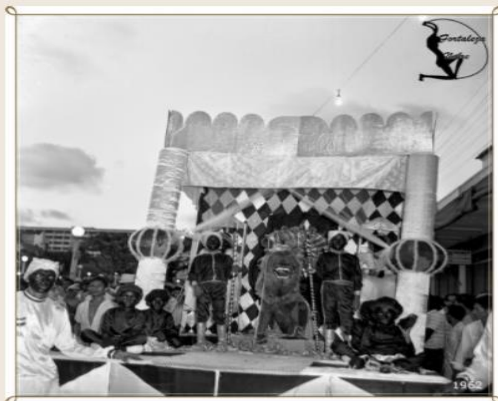
Maracatu Leão Coroado.

Há pouca documentação sobre a história do maracatu antes da década de 50. Os primeiros registros confiáveis de maracatu em Fortaleza datam do início do século XX, quando Gustavo Barroso descreve, em " Coração de menino ", os desfiles que ocorriam na Praça do Carmo (então Praça do Livramento ).