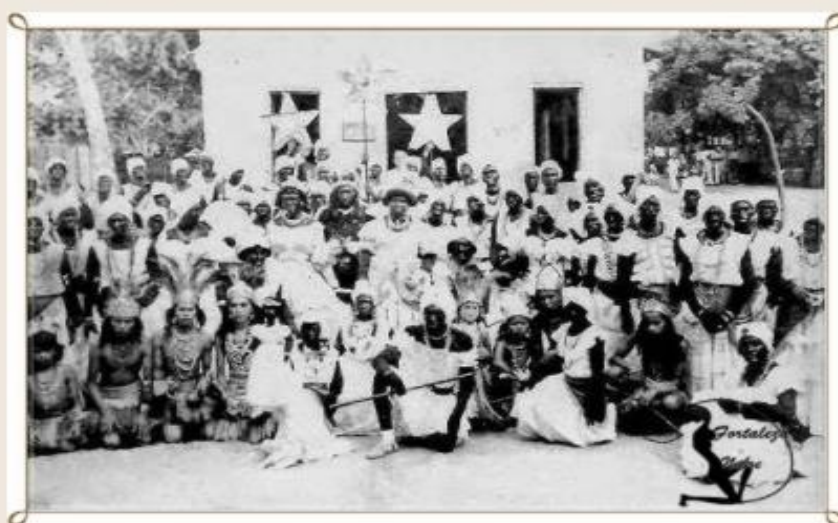
Maracatu Estrela Brilhante em 1953

Segundo relatos de personagens ilustres de nossa terra, o maracatu cearense já se mostrava presente desde meados do século XIX sendo o mesmo conhecido por “ congadas ou pelo auto dos reis de Congo” que retratavam os combates entre o Congo e Angola e que daria origem não só ao maracatu mas também a outras expressões culturais afro-descendentes como o reisado , caboclinhos e os pastoris .