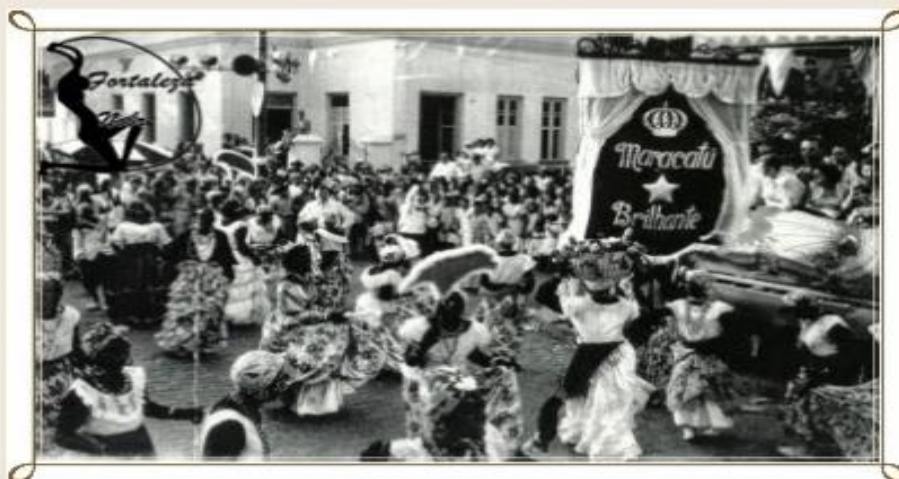
Maracatu Estrela Brilhante em 1953

Mesmo escravos, os negros construíam igrejas em homenagem à Santa onde se estabeleciam. Uma vez por ano, no dia 7 de outubro, dia de Nossa Senhora do Rosário, os escravos tinham folga. Nesse dia, faziam o ritual de coroação do rei e da rainha da irmandade.