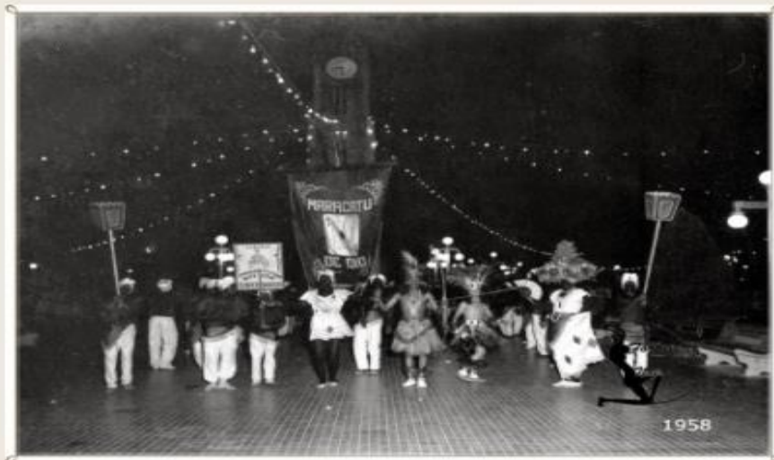
Maracatu Az de Ouro em 1958 na Praça do Ferreira - Nirez

O ponto culminante das congadas era a coroação do rei e da rainha negra que vinham acompanhados pelo seu séquito real composto por negros trajando cores bufantes dos mais variados tecidos e representando personagens da corte portuguesa. Em geral tais roupas eram usadas e doadas a irmandade para que pudessem ser realizadas as encenações como vestidos de noivas amplamente usados para caracterizarem as princesas e rainhas. Em determinadas épocas do ano a irmandade era contratada por senhores de engenho ou pessoas abastadas para apresentar seus autos, tais contribuições eram depositadas em um caixa controlado pelo tesoureiro sendo responsável o mesmo pelo controle dos bens da confraria que consistiam desde casas a terrenos espalhados pela cidade.