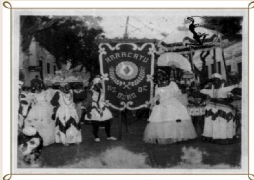
Maracatu Az de Ouro em 1958 no Centro de Fortaleza

O ponto culminante das congadas era a coroação do rei e da rainha negra que vinham acompanhados pelo seu séquito real composto por negros trajando cores bufantes dos mais variados tecidos e representando personagens da corte portuguesa. Em geral tais roupas eram usadas e doadas a irmandade para que pudessem ser realizadas as encenações como vestidos de noivas amplamente usados para caracterizarem as princesas e rainhas. Em determinadas épocas do ano a irmandade era contratada por senhores de engenho ou pessoas abastadas para apresentar seus autos, tais contribuições eram depositadas em um caixa controlado pelo tesoureiro sendo responsável o mesmo pelo controle dos bens da confraria que consistiam desde casas a terrenos espalhados pela cidade.