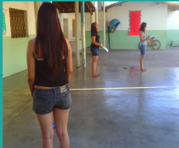
Encontros e ensaios: Elo Vanguarda de Theatro, 2011.