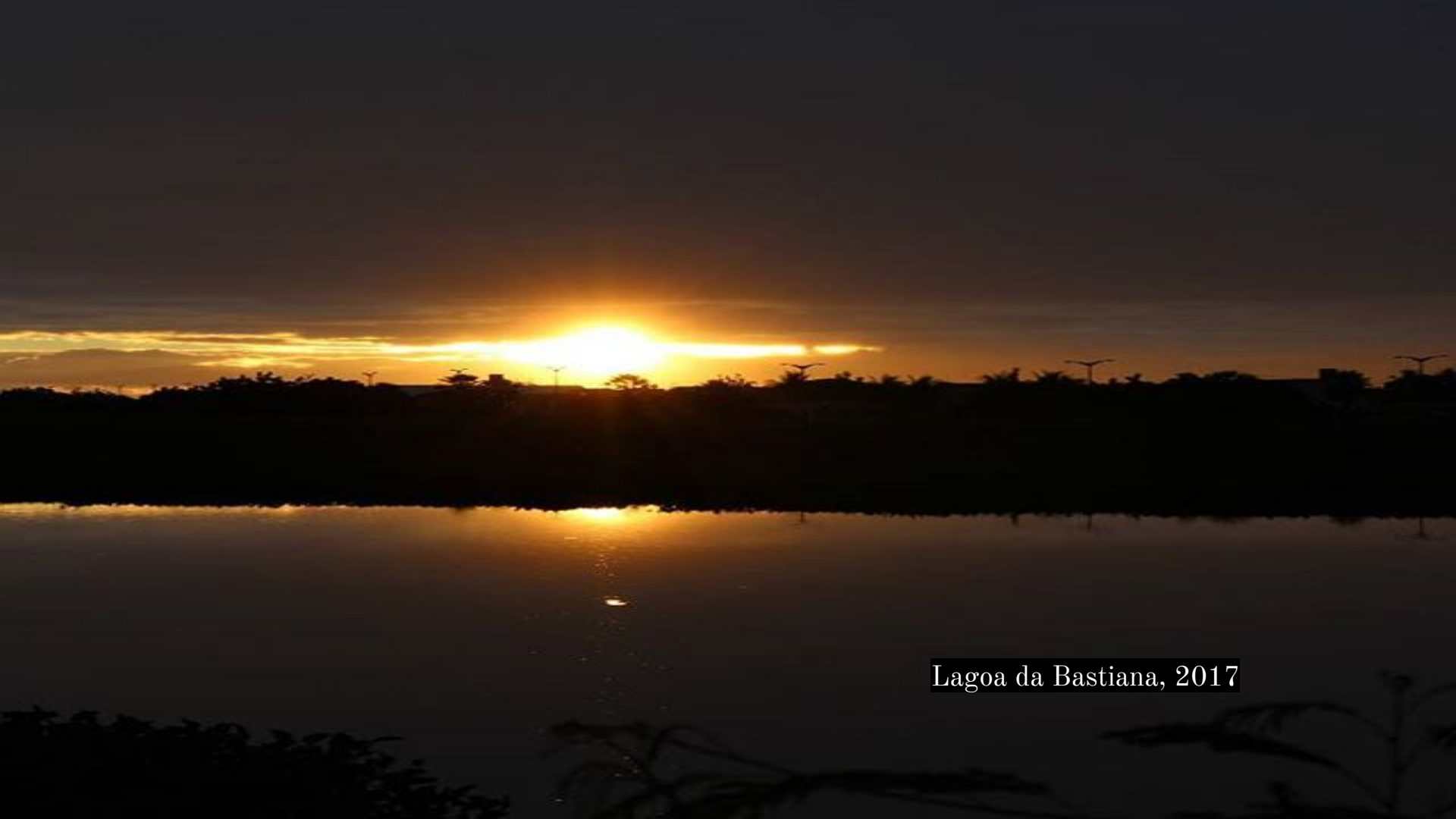
Lagoa da Bastiana, 2017