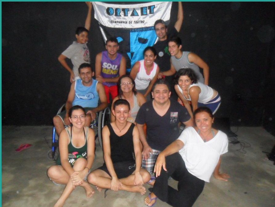
Oficina de Canto do projeto Olaria - 2011/2012 - Cia.Ortaet.