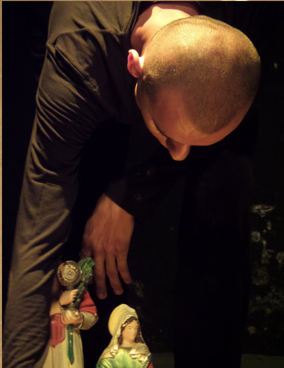
Foto do Espetáculo É Cor de Laranja, 2016