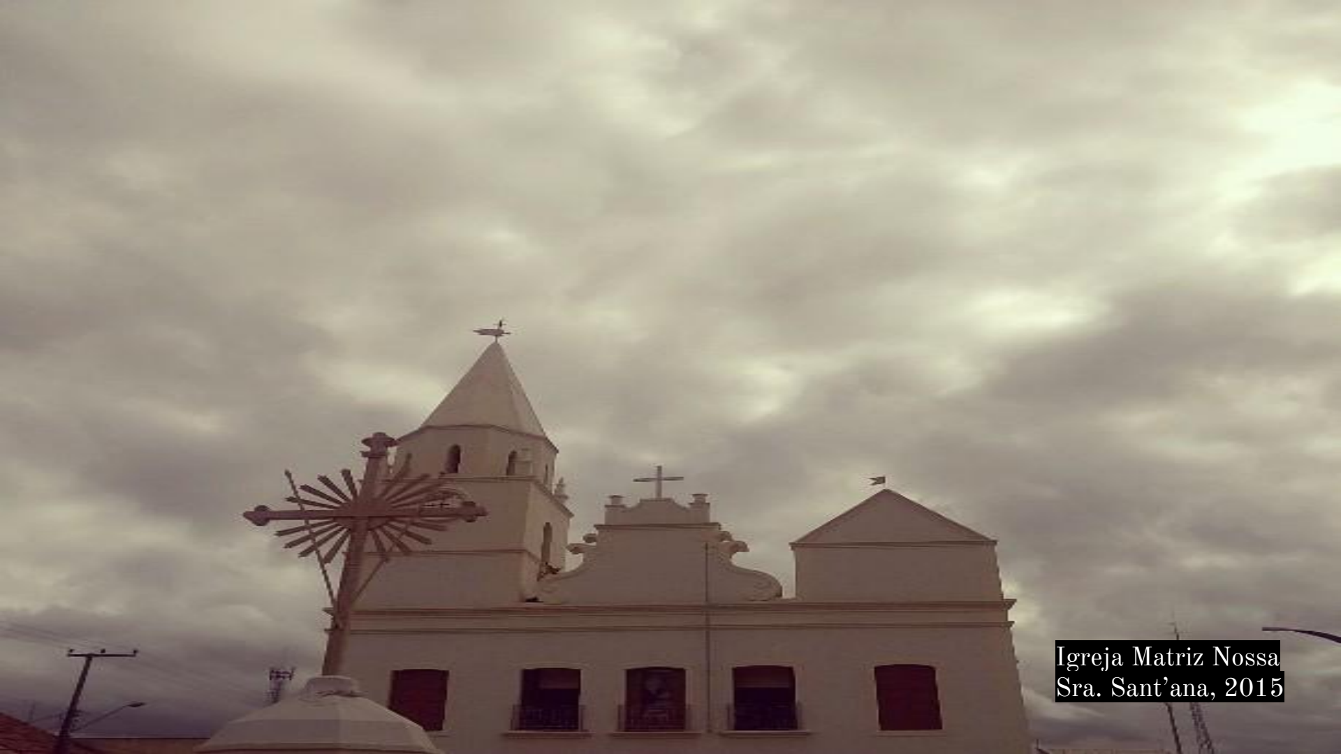
Igreja Matriz Nossa Sra. Sant'ana, 2015