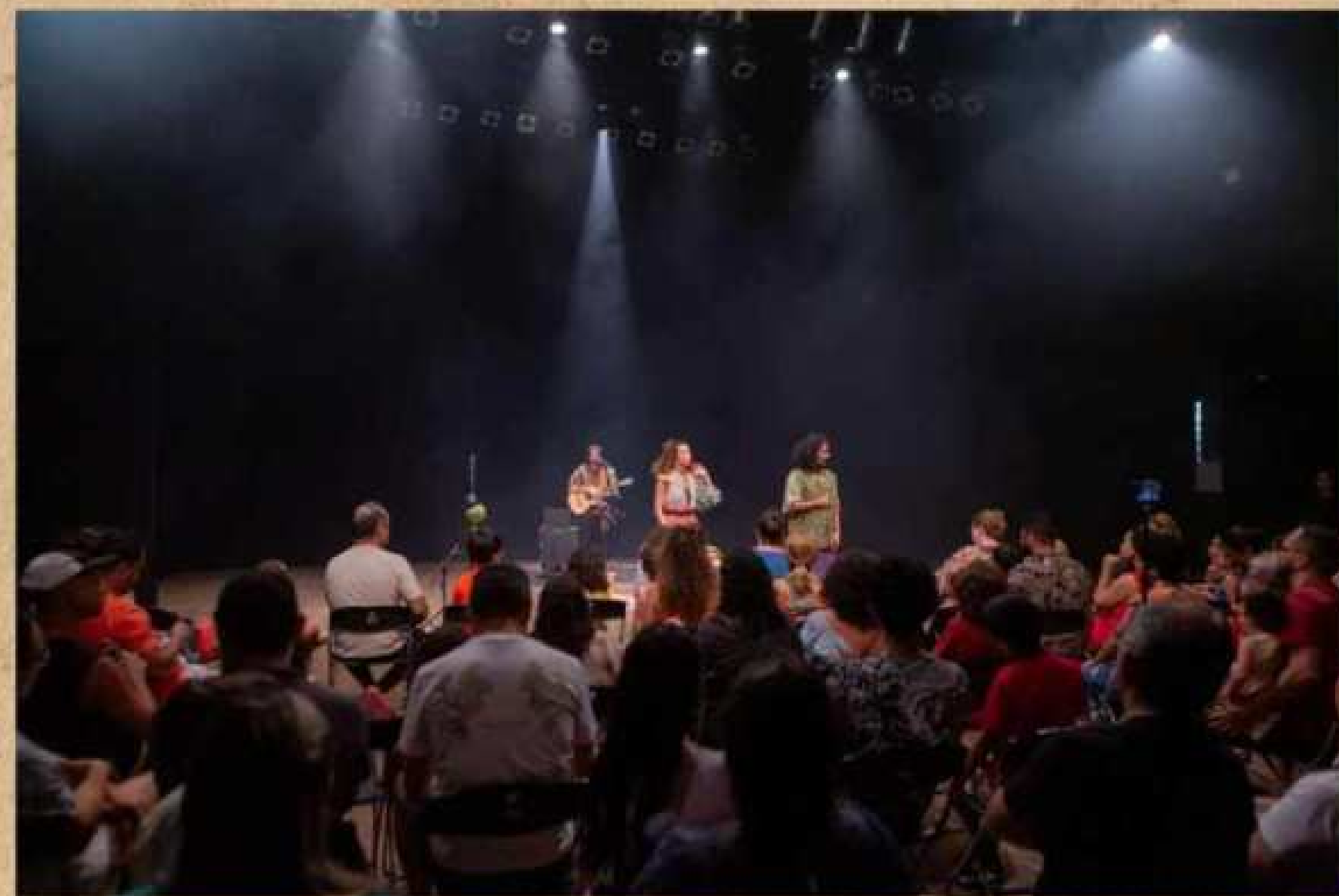
CINETEATRO SÃO LUIZ - FORTALEZA - CEARÁ 03 DE MARÇO DE 2024