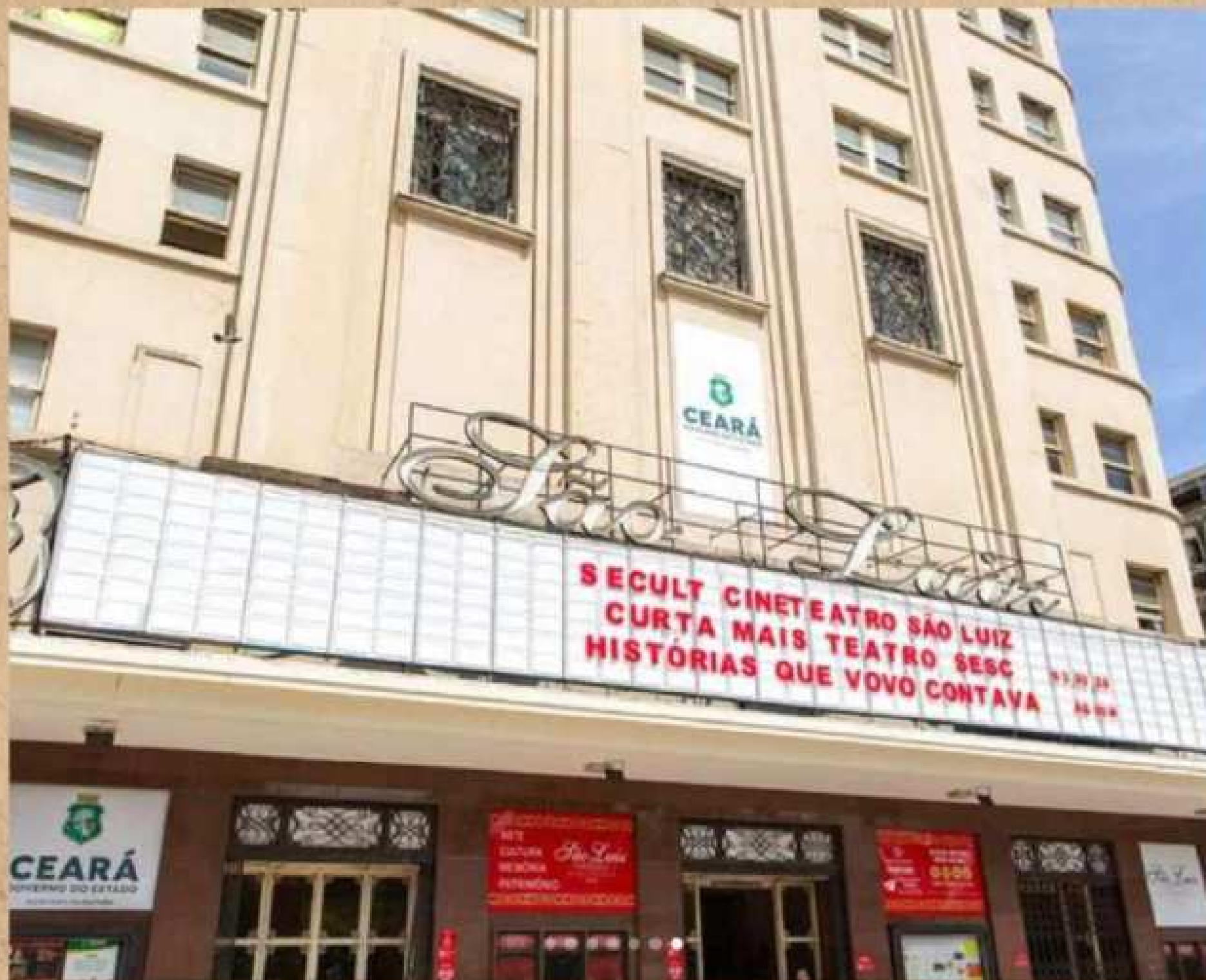
CURTA MAIS TEATRO PARCERIA SESC/CINETATRO SAO LUIZ