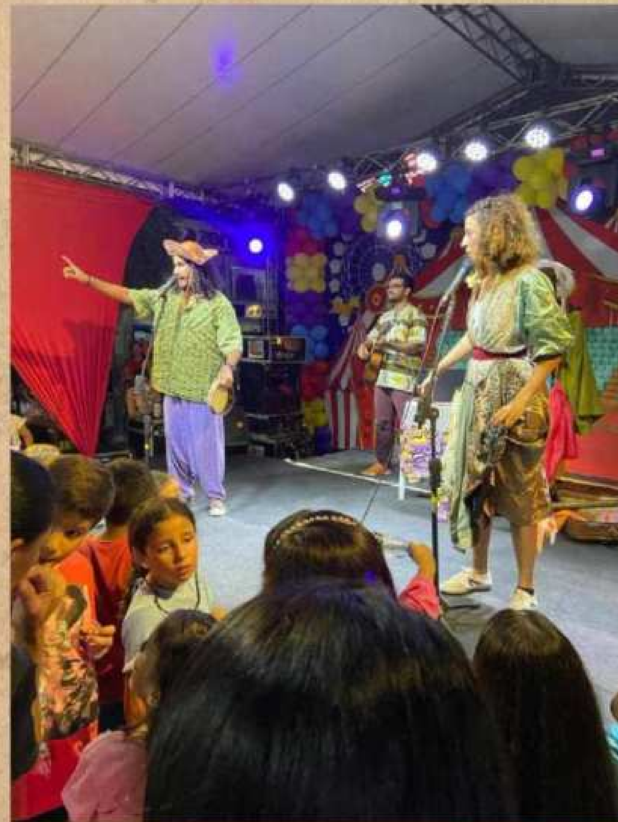
PRAÇA MATRIZ DE PEDRA BRANCA - CEARÁ 20 DE OUTUBRO DE 2023