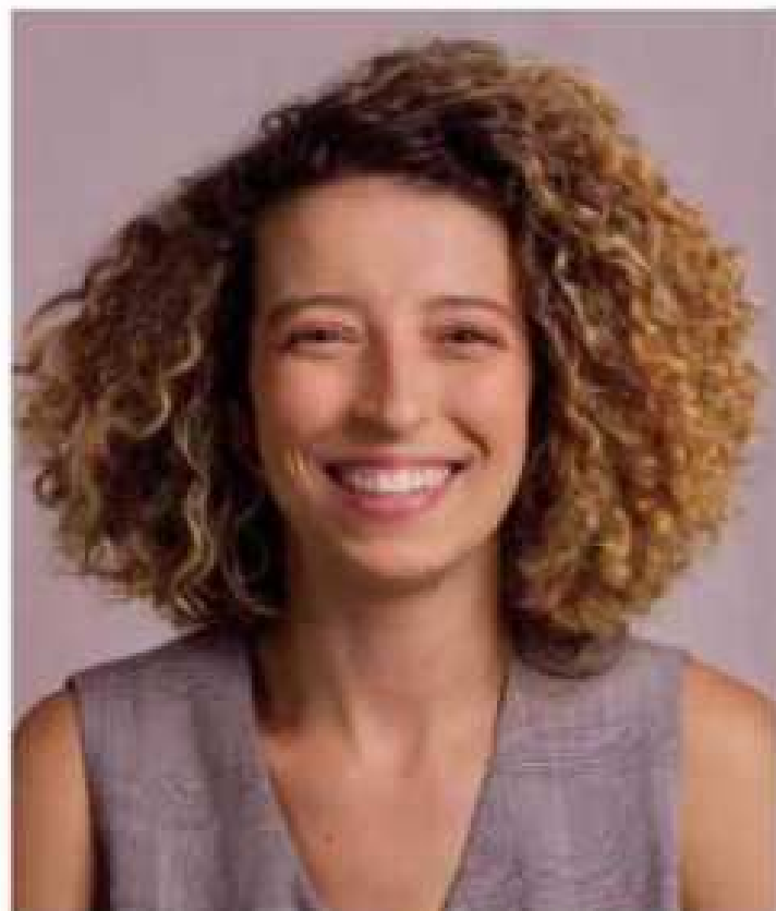
ATRIZ ROTEIRISTA E PRODUTORA DRT 2153 CE