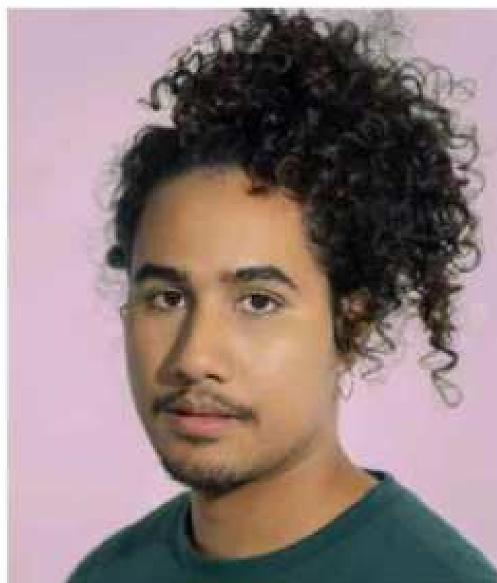
ATOR ROTEIRISTA COMPOSITOR E MUSICO DRT 2001 CE