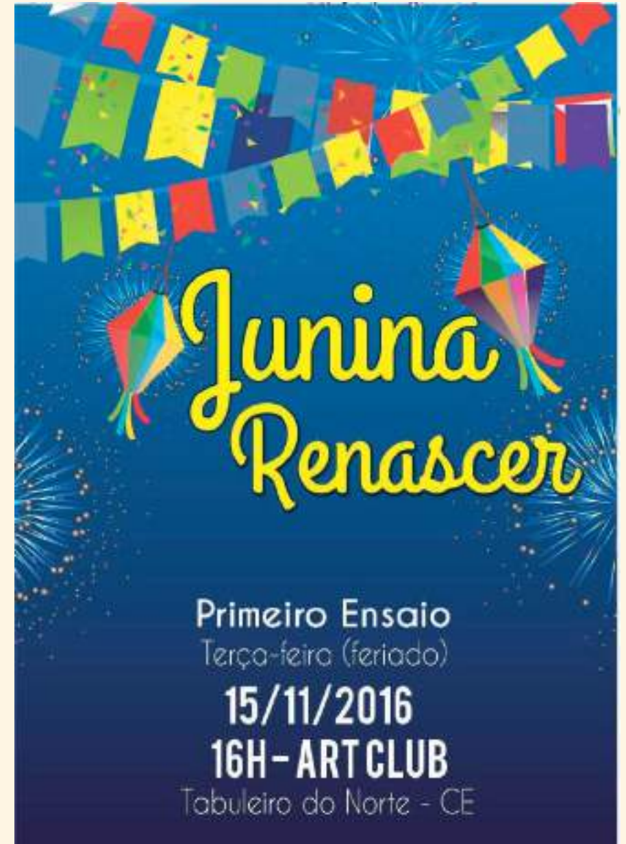
Banner de divulgação do PRIMEIRO ENSAIO