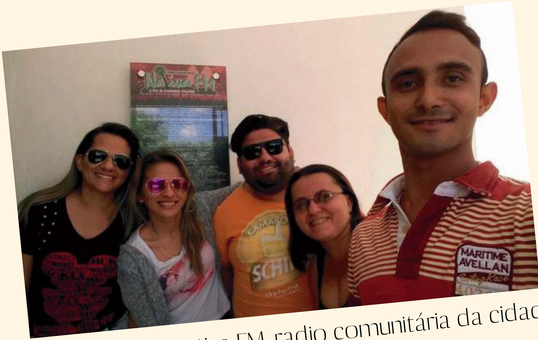
Divulgação na Nativa FM, radio comunitária da cidade

O início da mobilização do grupo para a captação de elenco, e a organização do nosso PRIMEIRO ENSAIO.