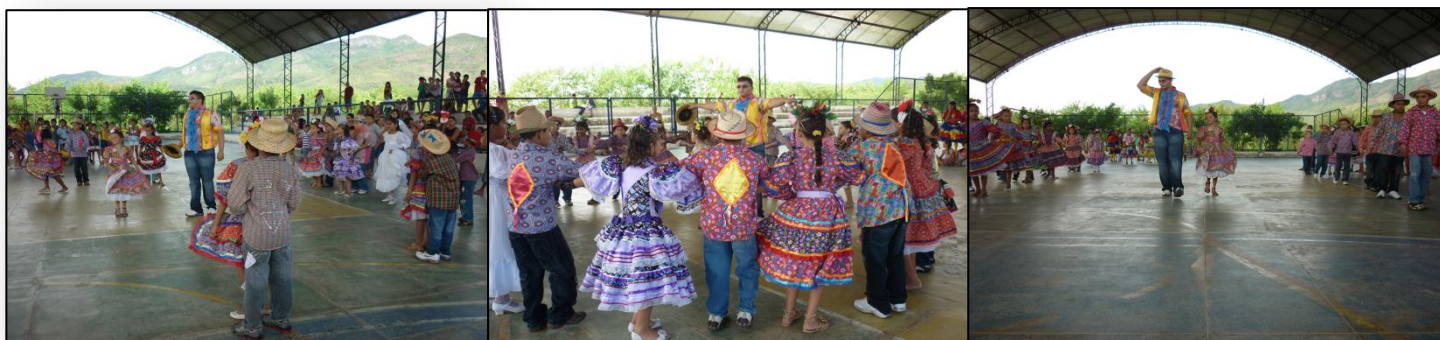
APRESENTAÇÃO DA QUADRILHA ARRAIÁ DO CUMPADE MATIAS NA CULMINÂNCIA DO PROJETO JUNINO DAS ESCOLAS DO DISTRITO – JUNHO 2010.