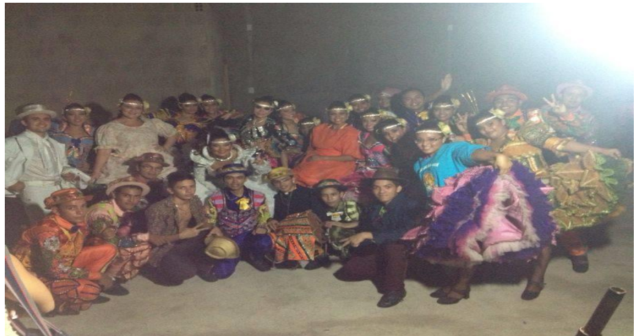
ESTREIA DA QUADRILHA ARRAIÁ DO SERTÃO NO FESTIVAL JUNINO DE JABUTI, ITAITINGA. JUNHO DE 2014.

Link: https://www.youtube.com/watch?v=QLB4l2sMljw