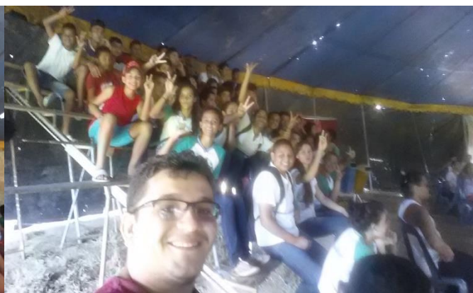
PARCERIA POLO E CIRCO TROPICAL, LEVANDO OS ALUNOS DA INSTITUIÇÃO A CONHECEREM UM POUCO DA HISTÓRIA DO CIRCO E DE SEUS ARTISTAS. MAIO DE 2016.