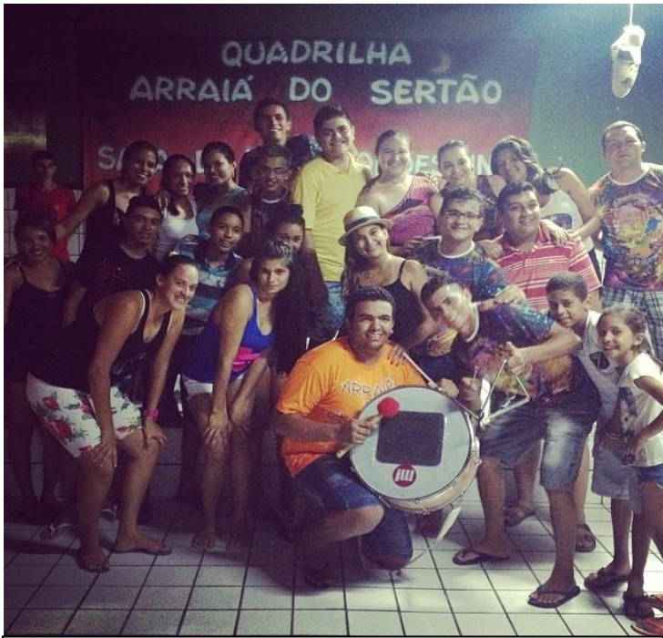
PRIMEIRO ENSAIO DA QUADRILHA ARRAIÁ DO SERTÃO DE AMANARI - MARÇO DE 2014.