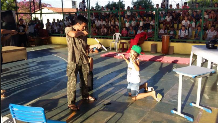
ATIVIDADE DE TEATRO DA I GINCANA DO POLO DE ATENDIMENTO JOÃO COELHO DA SILVA, OS ALUNOS APRESENTARAM ESQUETES RELACIONADOS AO TEMA DROGAS E VIOLÊNCIA. – OUTUBRO DE 2015