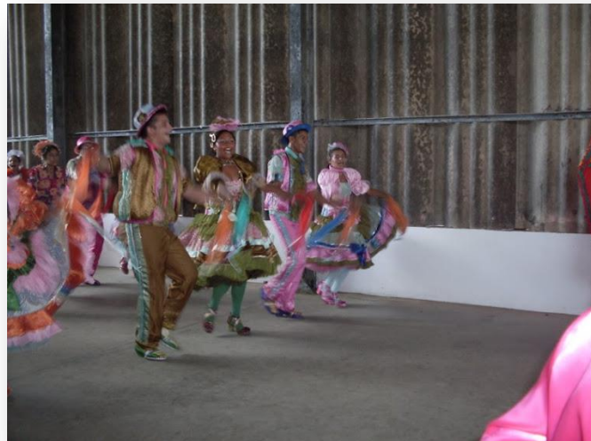
APRESENTAÇÃO DA QUADRILHA ARRAIÁ DO SERTÃO DE AMANARI NO COMPLEXO YPARK EM MARANGUAPE. JUNHO DE 2009