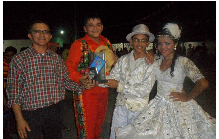
ESTREIA DA QUADRILHA ARRAIÁ DO SERTÃO DE AMANARI NO FESTIVAL DE CAJUEIRO EM MARANGUAPE, RECEBENDO O TROFÉU DE PARTICIPAÇÃO DAS MAOS DO ORGANIZADOR DO EVENTO. JUNHO DE 2013.