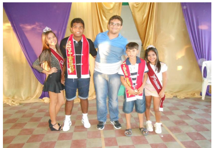
APRESENTAÇÃO E ORGANIZAÇÃO DO DESFILE DA ESCOLHA DA RAINHA, PRINCESA, REI E PRÍNCIPE DA ESCOLA MUN. PROFESSORA MARIA EUGÊNIA DE OLIVEIRA. FOTO COM OS VENCEDORES DE CADA CATEGORIA. AGOSTO DE 2014.