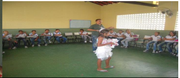
I GINCANA ESPORTIVA E CULTURAL DA ESCOLA MUN. BÁRBARA DE ALENCAR – TURMA DO 5º ANO “B” – EQUIPE VENCEDORA. NESSAS FOTOS ESTÃO ALGUMAS DAS ATIVIDADES DESENVOLVIDAS: ROUPA DE RECICLAGEM, SALA TEMÁTICA DO ESTADO DO CEARÁ E PERSONAGENS FAÍSCA E ESPOLETA DA PEÇA “O CASAMENTO DA FILHA DE LAMPIÃO”. SEGUNDO SEMESTRE DE 2012.