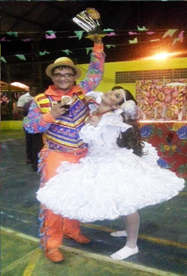
RECEBENDO A PREMIAÇÃO DE MELHOR MARCADOR E MELHOR QUADRILHA DAS MÃOS DOS ORGANIZADORES DO EVENTO- JULHO DE 2014.