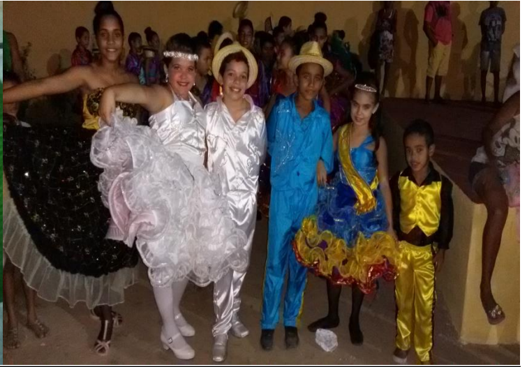
QUADRILHA INFANTIL RAÍZES DO SERTÃO, A QUAL PRESIDIDO ATÉ OS DIAS ATURAI, EM SEU PRIMEIRO ANO DE APRESENTAÇÃO. A PRIMEIRA FOTO RETRATA A ESTREIA DO GRUPO NO XV FESTEJO MARANGUAPE JUNINO E A SEGUNDA NA IGREJA DE SÃO JOÃO BATISTA, HOMENAGEM AO PADROEIRO DE AMANARI. JUNHO E 2015.