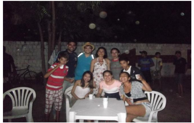
COLABORAÇÃO NA ORGANIZAÇÃO DO FESTIVAL JUNINO DA ESCOLA MUN. JOSÉ DE SOUZA ALBUQUERQUE, JUNHO DE 2013