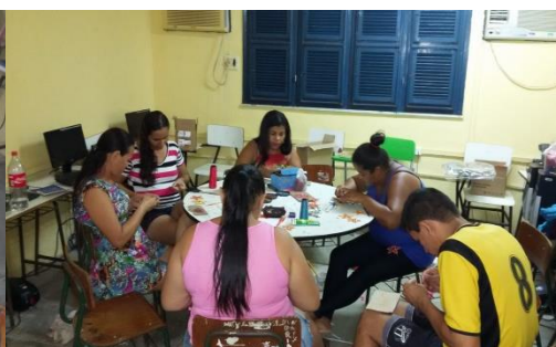
OFICINAS DE ARTESANATO PARA COMPONENTES E PAIS, CRIAÇÃO DE ADEREÇOS – QUADRILHA INFANTIL RAÍZES DO SERTÃO EM PARCERIA COM O POLO DE ATENDIMENTO JOÃO COELHO. MAIO DE 2016.