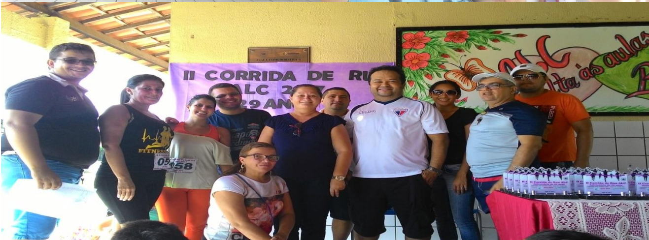
COLABORADOR DA I E II CORRIDA DE RUA ALC. ABRIL DE 2016 E DE 2017.