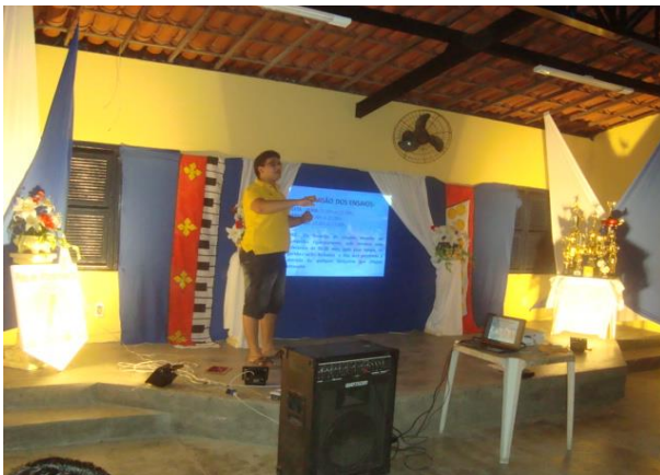
APRESENTAÇÃO DO PROJETO DA QUADRILHA ARRAIÁ DO SERTÃO “A SAGA DO POVO NORDESTINO” - FEVEREIRO DE 2013.