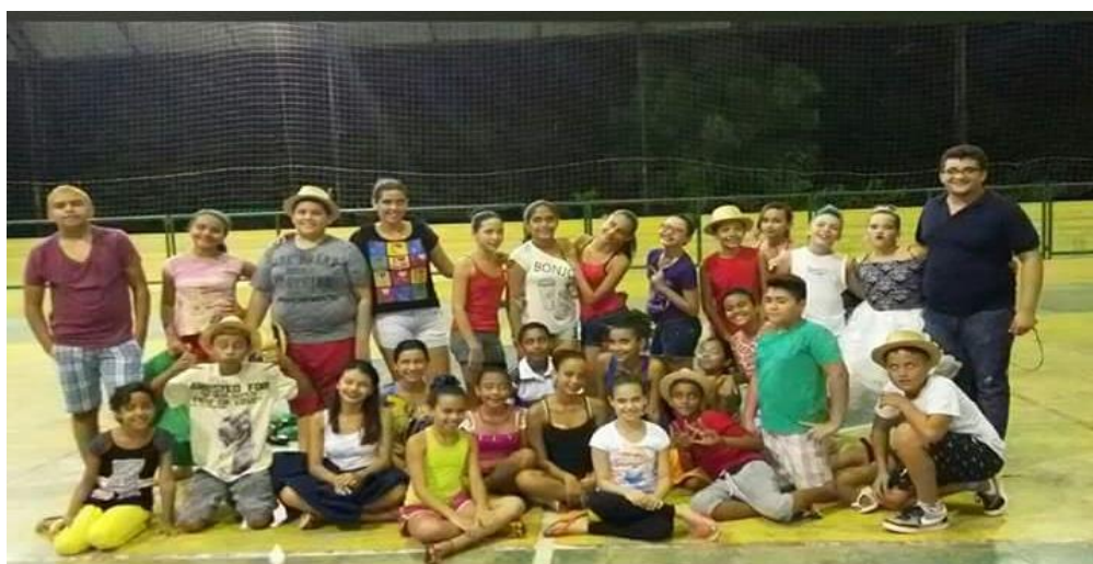
PRIMEIRO ENSAIO DA QUADRILHA INFANTIL RAÍZES DO SERTÃO - FEVEREIRO DE 2016.