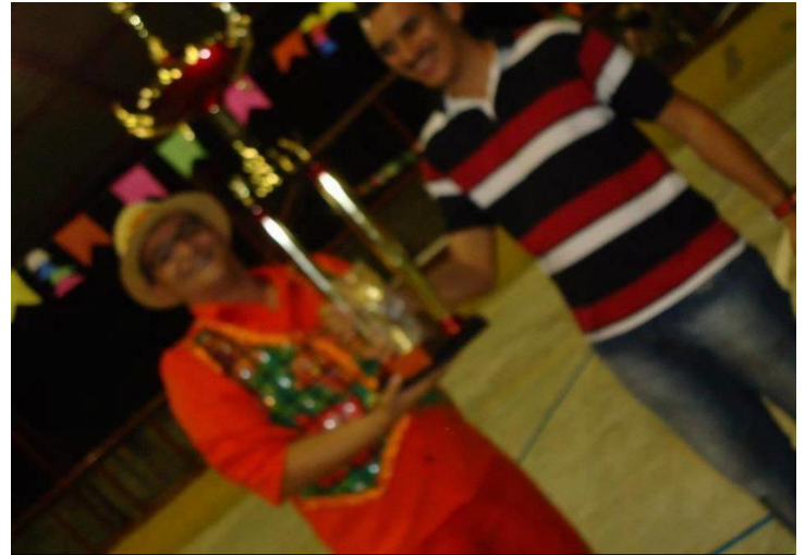
FESTIVAL DE QUADRILHAS DE LAGES, MARANGUAPE. RECEBENDO O TROFÉU DE 1º LUGAR DA QUADRILHA ARRAIÁ DO SERTÃO DAS MÃOS DO ORGANIZADOR DO EVENTO – JUNHO DE 2012.

Link: https://www.youtube.com/watch?v=c3il7jlkXA8