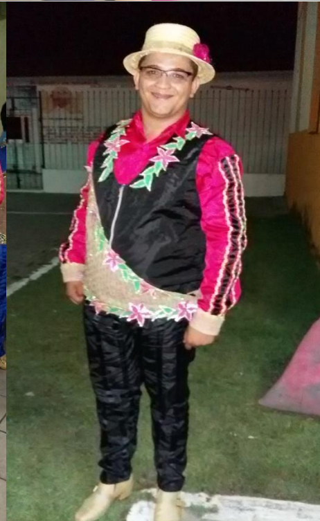
DANÇARINO DA QUADRILHA TRADIÇÃO SERRANA DE MARANGUAPE – 2015.

LINK: https://www.youtube.com/watch?v=-Cgo_FuQ0kg