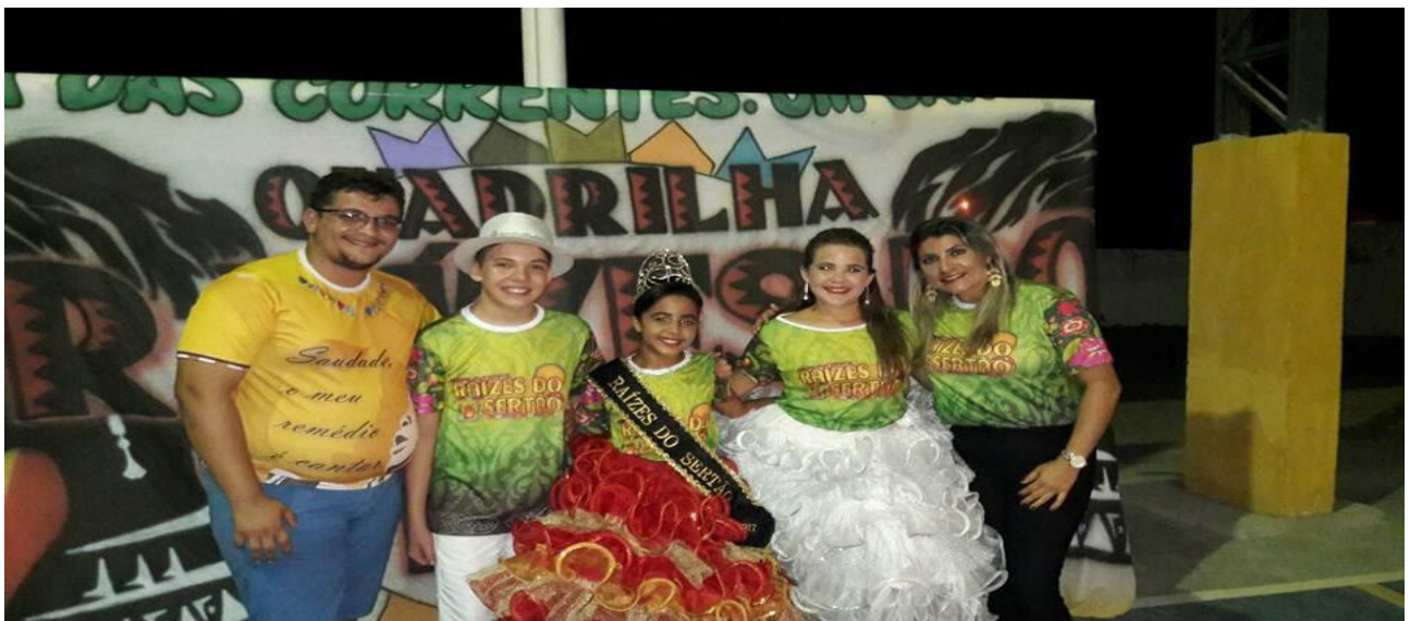
ORGANIZADOR DA FESTA DE LANÇAMENTO DA QUADRILHA INFANTIL RAÍZES DO SERTÃO DE AMANARI – JANEIRO DE 2017.