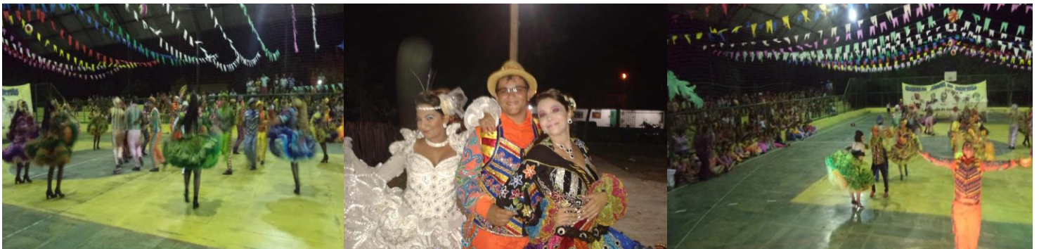
ÚLTIMA APRESENTAÇÃO DA QUADRILHA ARRAIÁ DO SERTÃO NO II FESTIVAL AMANARI JUNINO, ONDE A MESMA SE CONSAGROU CAMPEÃ E COM OS TÍTULOS DE MELHOR NOIVA, RAINHA E MARCADOR. JULHO DE 2014.

Link: https://www.youtube.com/watch?v=QLB4l2sMljw