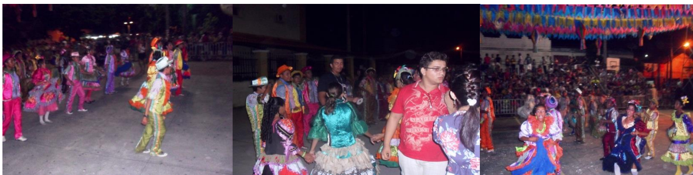
APRESENTAÇÃO DA QUADRILHA INFANTIL ARRAIÁ DO SERTÃO NO FESTIVAL XI MARANGUAPE JUNINO - JUNHO DE 2011.