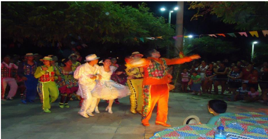
APRESENTAÇÃO DA QUADRILHA ARRAIÁ DO SERTÃO NO FESTIVAL DE QUADRILHA DE TABATINGA E NA COMPETIÇÃO RECEBI O TÍTULO DE MELHOR MARCADOR DA REGIÃO, REPRESENTADO PELA FOTO AO LADO. JULHO DE 2012.