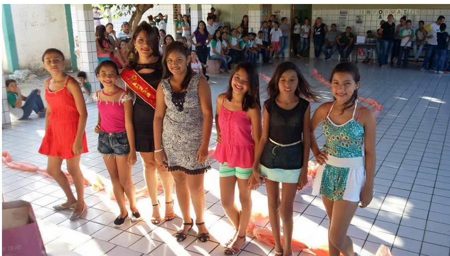
ORGANIZAÇÃO DO DESFILE DE ESCOLHA DAS REALEZAS DO POLO DE ATENDIMENTO JOÃO COELHO DA SILVA – AGOSTO DE 2015