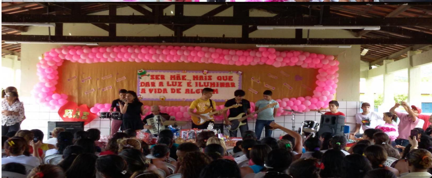
ORGANIZAÇÃO DA FESTA EM HOMENAGEM AO DIA DAS MÃES DO POLO DE ATENDIMENTO JOÃO COELHO DA SILVA E ESCOLA DE ENSINO MÉDIO E FUNDAMENTAL ANTÔNIO LUIZ COELHO. MAIO DE 2015.