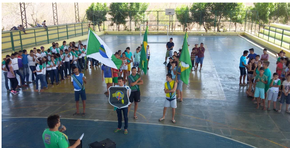
ELABORADOR, ORGANIZADOR E ORIENTADOR DA TEMÁTICA CULTURAL DO PROJETO DA I GINCANA ESORTIVA, CULTURAL PEDAGÓGICA E SOCIAL DO POLO DE ATENDIMENTO JOÃO COELHO DA SILVA. ABERTURA OFICIAL DO EVENTO – OUTUBRO DE 2015.