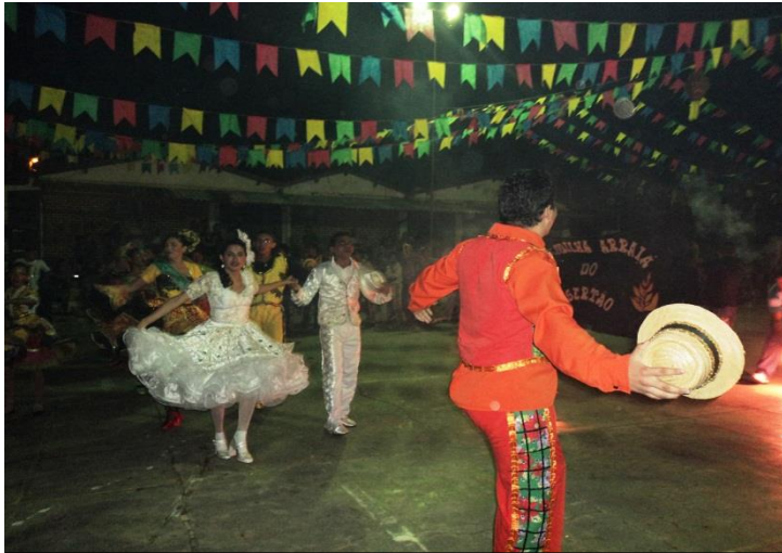
ESTREIA DA QUADRILHA ARRAIÁ DO SERTÃO DE AMANARI NA CIDADE DE PARAMOTI. JUNHO DE 2012.

Link: https://www.youtube.com/watch?v=c3il7jlkXA8