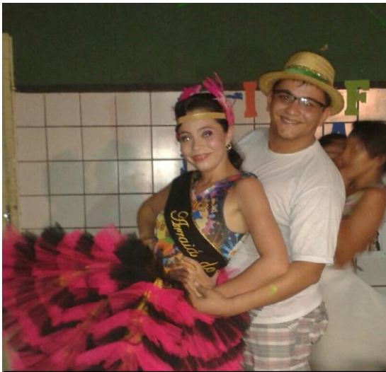
APRESENTAÇÃO DA NOVA RAINHA DA QUADRILHA ARRAIÁ DO SERTÃO – MAIO DE 2014.