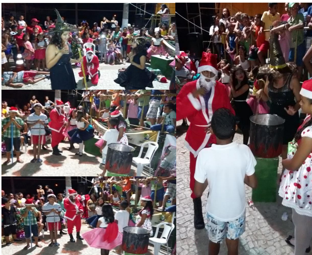
DIREÇÃO DA PEÇA TEATRAL “ENTÃO É NATAL”, APRESENTADA PELOS ALUNOS DO PROJETO DA QUADRILHA INFANTIL RAÍZES DO SERTÃO EM PARCERIA COM O POLO DE ATENDIMENTO JOÃO COELHO DA SILVA, APRESENTAÇÃO NA PRAÇA DE AMANARI, MARANGUAPE. DEZEMBRO DE 2015.