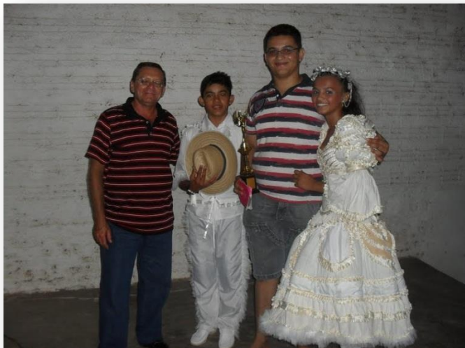
APRESENTAÇÃO DA QUADRILHA INFANTIL CORAÇÃO NORDESTINO NA COMUNIDADE DE CAJUEIRO, MARANGUAPE – JUNHO DE 2008.