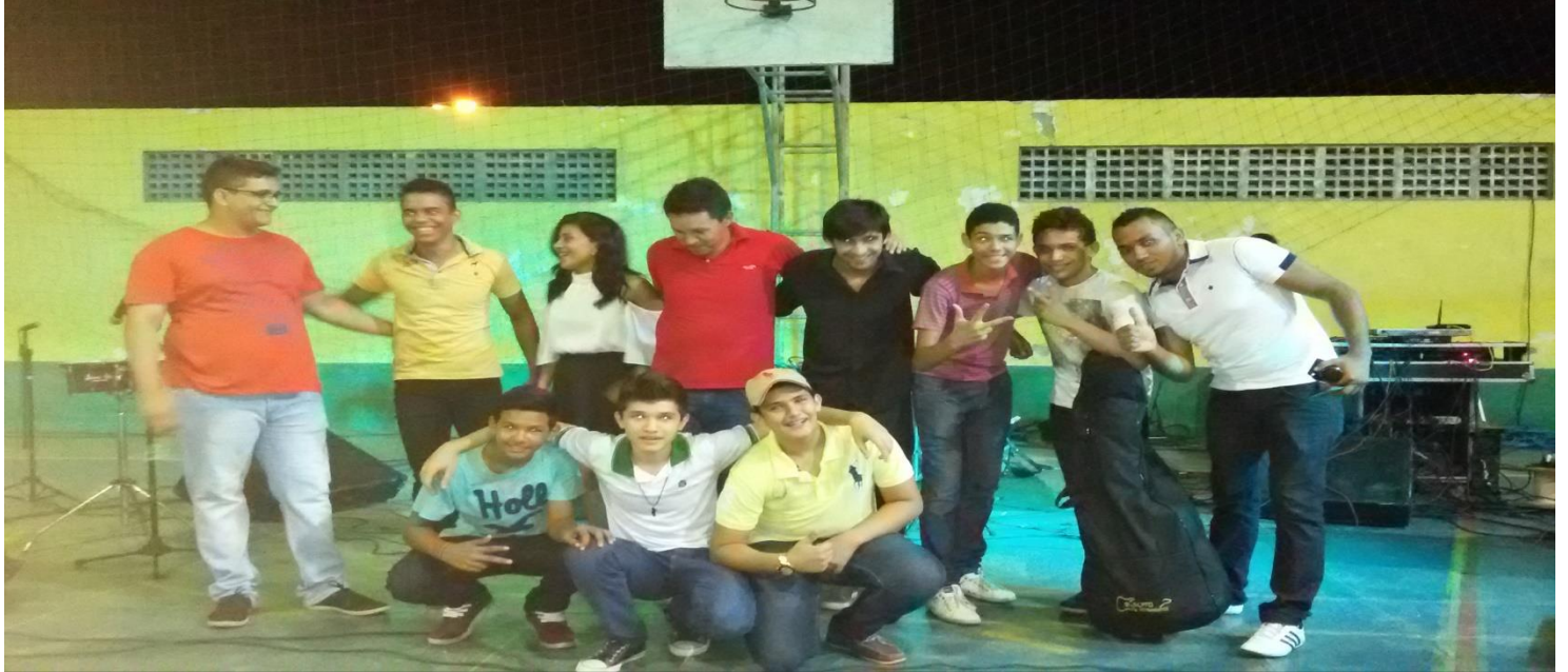
ELABORAÇÃO E ORGANIZAÇÃO DO PROJETO BAILE DA INTEGRAÇÃO SOCIAL, ESTE QUE SE REALIZOU EM PARCERIA COM O CRAS DE AMANARI E PROJETOS SOCIAIS MUNICIPAIS. FOTO DAS ALUNAS DO PROJETO MULHERES EM MOVIMENTO; FOTO DA BANDA MUSICAL (PROJETO DO POLO DE ATENDIMENTO JOÃO COELHO DA SILVA). MAIO DE 2015.