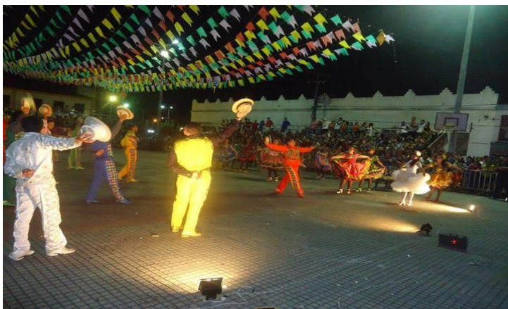
APRESENTAÇÃO DA QUADRILHA ARRAIÁ DO SERTÃO DE AMANARI NO XIII FESTIVAL MARANGUAPE JUNINO FESTEIRO. JULHO DE 2013.

Link: https://www.youtube.com/watch?v=6VZ1I01_Or4