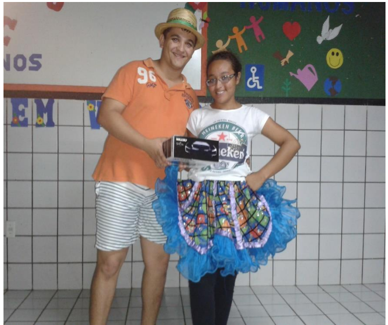
ENTREGA DO BRINDE À VENCEDORA DO SORTEIO REALIZADO PELA QUADRILHA ARRAIÁ DO SERTÃO DE AMANARI – ABRIL DE 2014.