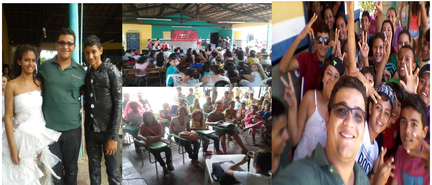
PROFESSOR-ORIENTADOR DA TURMA CAMPEÃ (7º ANO "A") DA GINCANA CULTURAL DA ESCOLA MUN. PROFESSORA MARIA EUGÊNIA, ONDE TIVERAM DESTAQUES NA ROUPA DE MATERIAL RECICLÁVEL (CASAL DE NOIVOS), TALENTO MUSICAL E NO ESQUETE TEATRAL "ESCOLINHA DA MARIA EUGÊNIA" (UMA HOMENAGEM AOS FUNCIONÁRIOS DA INSTITUIÇÃO). DEZEMBRO DE