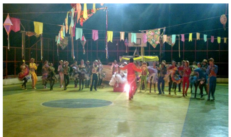
APRESENTAÇÃO DA QUADRILHA ARRAIÁ DO SERTÃO DE AMANARI NO FESTIVAL DE CAHOEIRAS, EM MARANGUAPE, ONDE FOMOS CAMPEÕES DO EVENTO. JUNHO DE 2013.

Link: https://www.youtube.com/watch?v=6VZ1I01_Or4