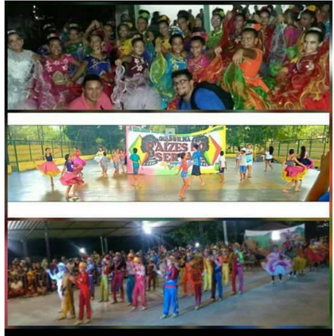
PRESIDENTE DA QUADRILHA INFANTIL RAÍZES DO SERTÃO DE AMANARI – FOTOS DE ALGUMAS APRESENTAÇÕES DO GRUPO. JUNHO E JULHO DE 2016.

LINK: https://www.youtube.com/watch?v=qgQ-4IGxABY