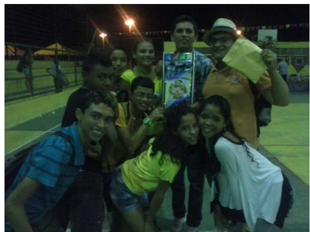
RECEBENDO A PREMIAÇÃO DE 1º LUGAR PARA A QUADRILHA ARRAIÁ DO SERTÃO NO FESTIVAL DE AMANARI, DAS MÃOS DO ORGANIZADOR E DE UMA DAS PATROCINADORAS DO EVENTO. JULHO DE 2012.