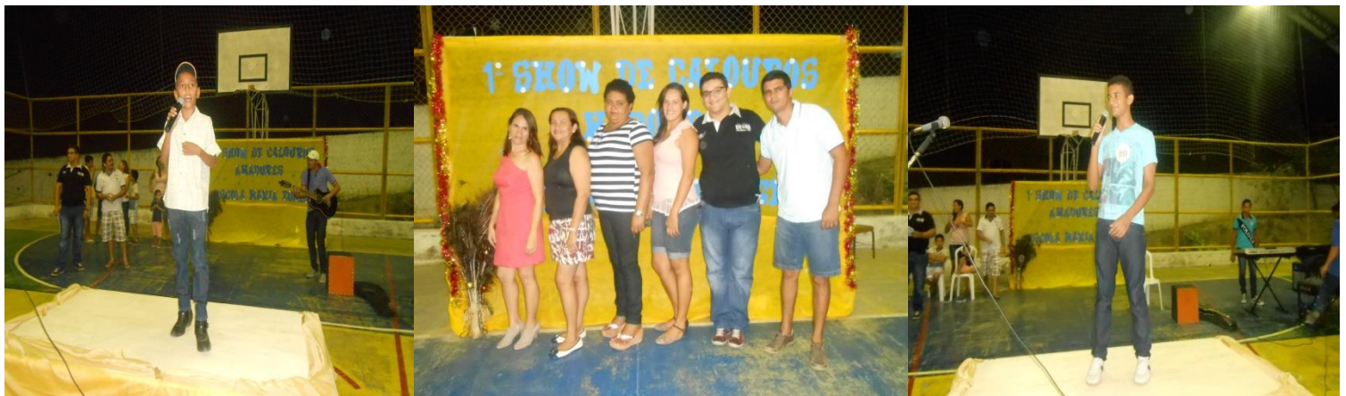
ORGANIZAÇÃO E APRESENTAÇÃO DO 1º SHOW DE CALOUROS AMADORES DA ESCOLA MUN. PROFESSORA MARIA EUGÊNIA DE OLIVEIRA. OUTUBRO DE 2014