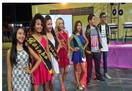
ORGANIZAÇÃO E APRESENTAÇÃO DO DESFILE DA ESCOLHA DAS REALEZAS DO POLO DE ATENDIMENTO JOÃO COELHO DA SILVA. AGOSTO DE 2016