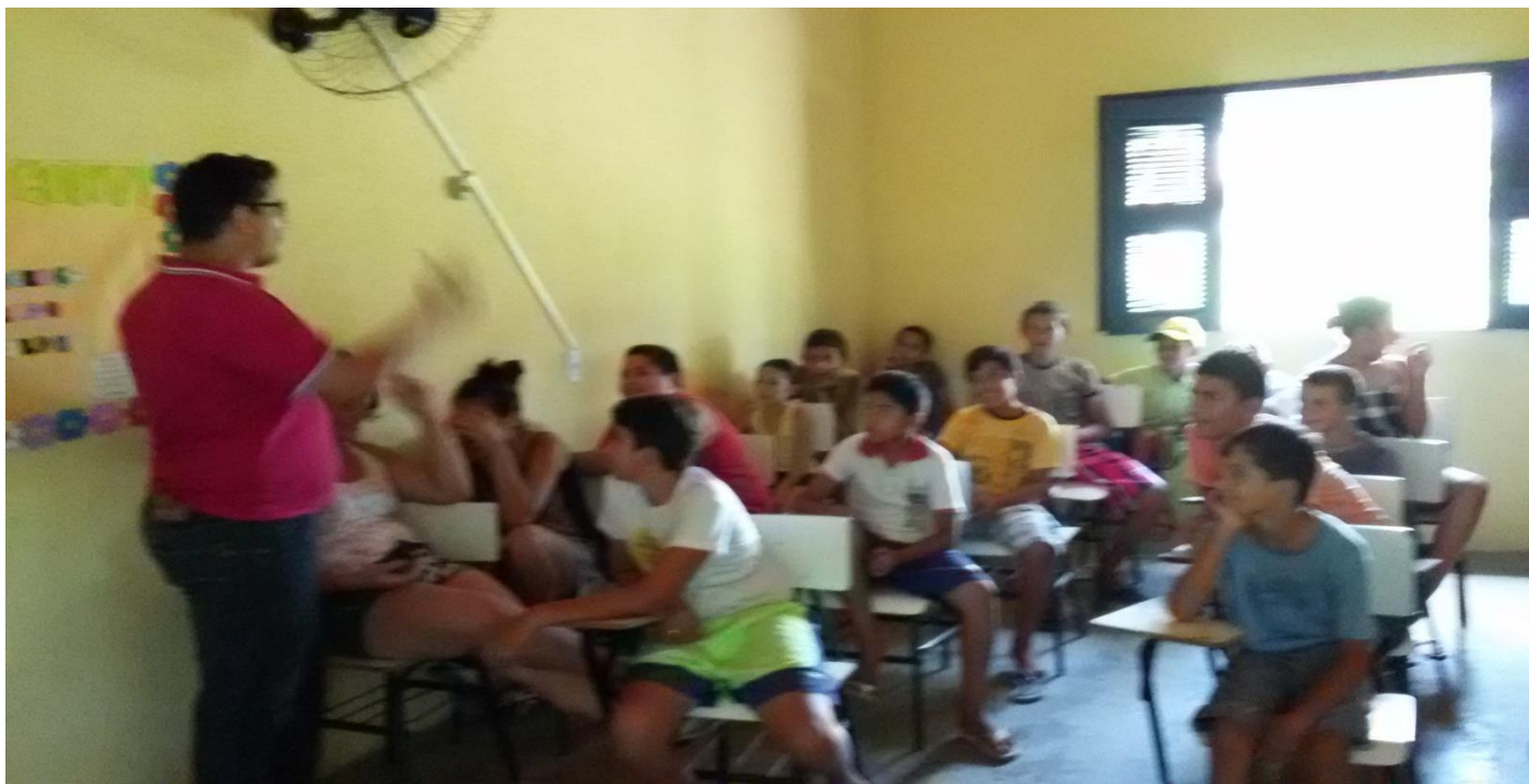
PRIMEIRA REUNIÃO DO PROJETO DA QUADRILHA INFANTIL RAÍZES DO SERTÃO – MARÇO DE 2015.