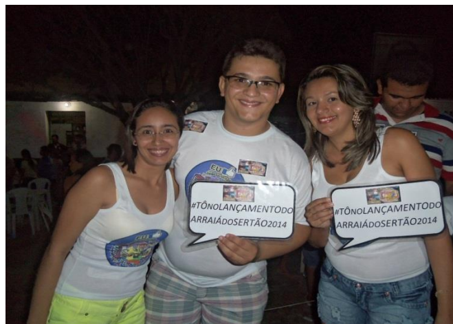
BLITZ DE DIVULGAÇÃO DA FESTA DE LANÇAMENTO DA QUADRILHA ARRAIÁ DO SERTÃO DE AMANARI – FEVEREIRO DE 2014.