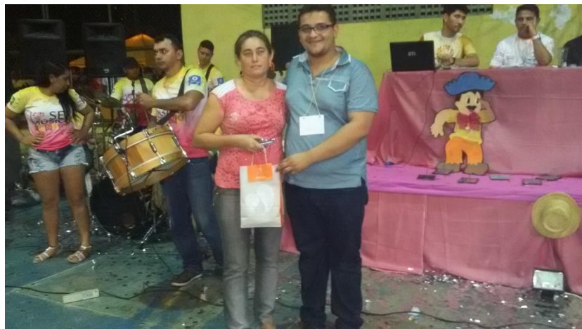
ORGANIZAÇÃO DO IV FESTIVAL AMANARI JUNINO. ENTREGA DE BRINDE SORTEADO PARA A O PÚBLICO PRESENTE NO EVENTO. JULHO DE 2017

LINK: https://www.youtube.com/watch?v=qgQ-4IGxABY