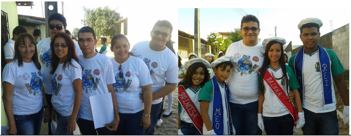
EQUIPE ORGANIZADORA DO DESFILE CÍVICO DA ESCOLA MUN. MARIA EUGÊNIA DE OLIVEIRA E REALEZAS DA ESCOLA. SETEMBRO DE 2014.