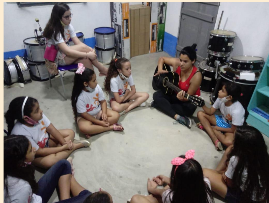
Grupo de Coral