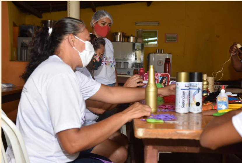
Curso de Artesanato