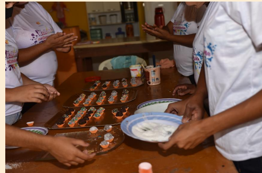
Curso de Culinária