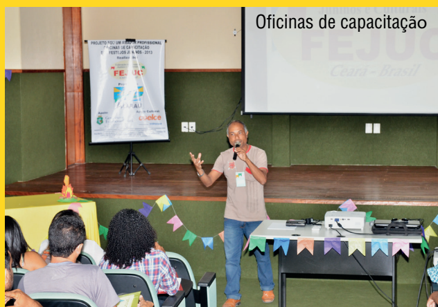
Oficinas de capacitação