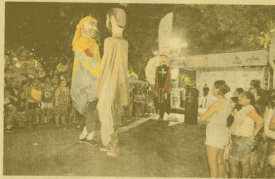
Além da comunidade do Monte Castelo, moradores de outros bairros também compareceram para ver a peça teatral com bonecos gigantes.

Já o humor ficou por conta da turma do Silvino's Night, da TV Diário, que comandou um concurso de calouros com os frequentadores do Polo de Lazer.