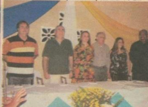
Autoridades de Pacatuba e Pacajus