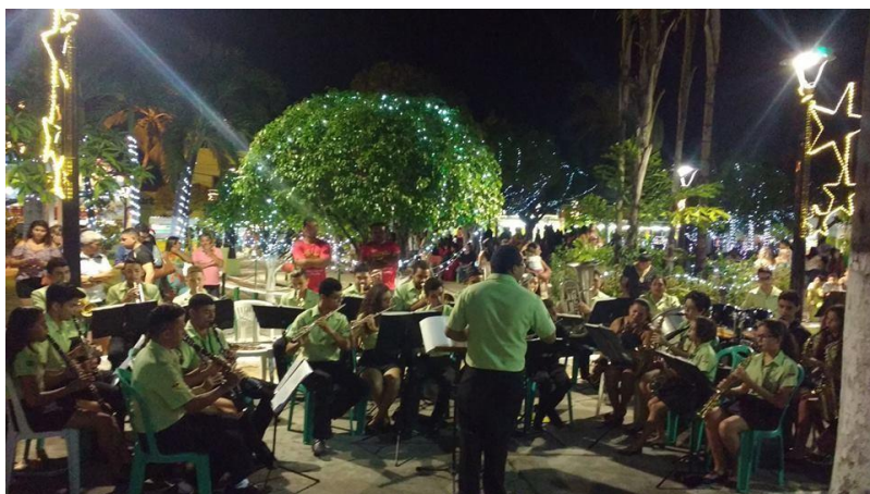
- Encerramento do novenário de N. Sra. Da Imaculada Conceição.