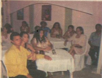
Familiares e amigos prestigiam o evento