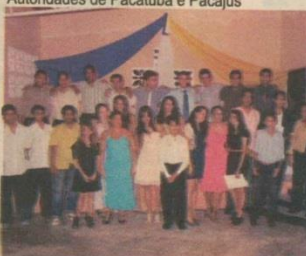
Concludentes posam para posteridade