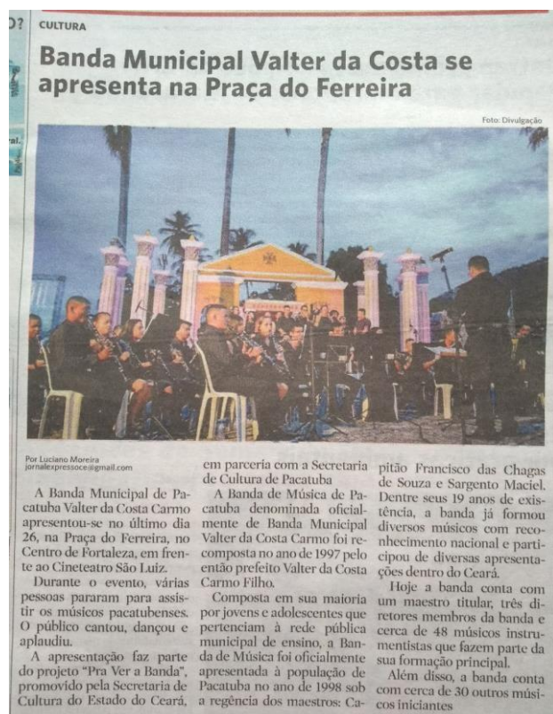
Figura 1. Jornal Expresso.

-Apresentação Projeto Pra ver a Banda – Centro Dragão do Mar de Arte e Cultura 13/05/2018.