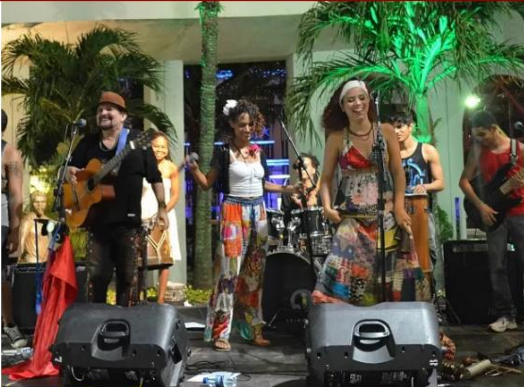
Parahyba & Cia. Bate Palmas é a atração desta sexta-feira (15) no Mercado dos Pinhões

6. O Mercado dos Pinhões segue promovendo a diversidade cultural em sua programação. Na sexta-feira (15), às 20h, a atração será Parahyba & Cia. Bate Palmas. A música