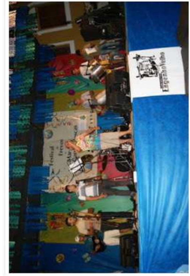
Realização anualmente do Festival de Frevos e Marchas Carnavalescas.

Vejam alguns registros das nossas ações: