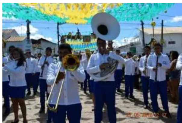
Filarmônica na Festa de Santo Antônio 2018

Filarmônica de cara nova na Festa de Santo Antônio