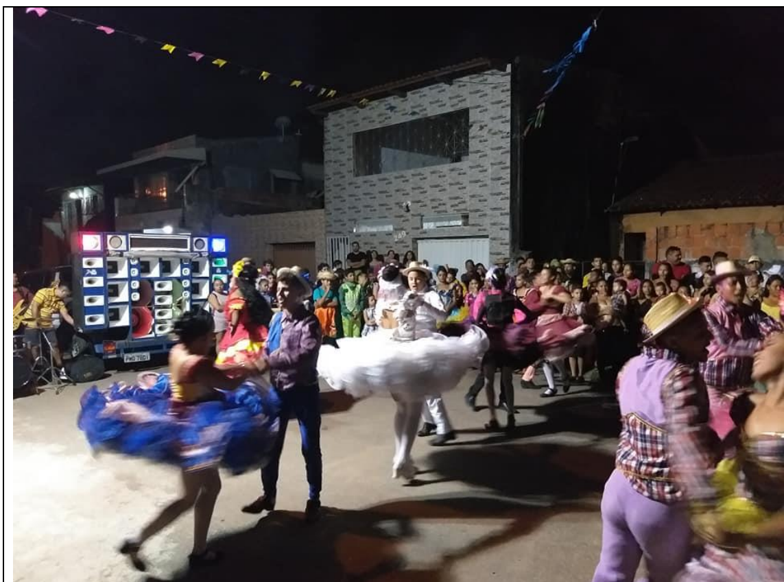
ARRAIÁ DO SUMARÉ – SIQUEIRA