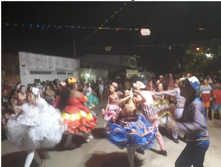
PROJETO UM SÃO JOÃO DE RESGATE AS TRADIÇÕES – JUNINA NORDESTINA 2019