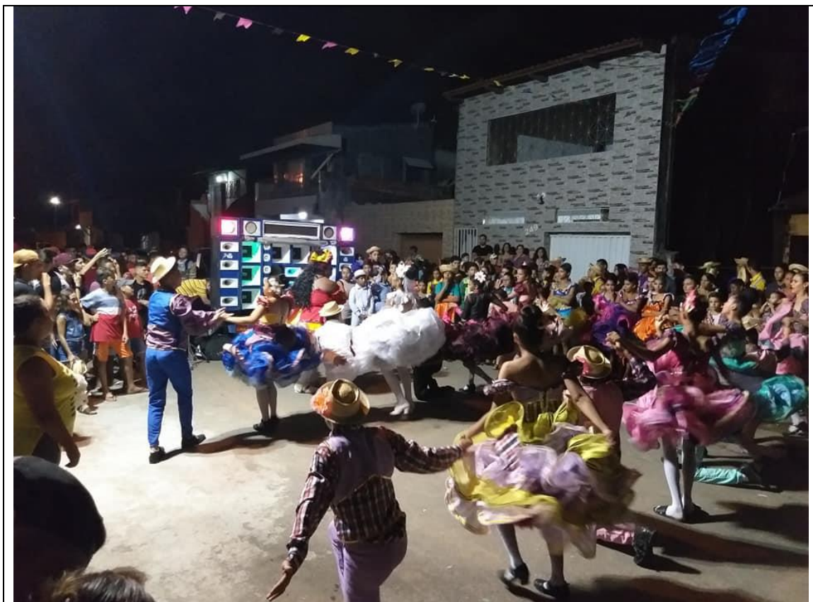
TEMPORADA 2019 – UM SÃO JOÃO DE RESGATE AS TRADIÇÕES