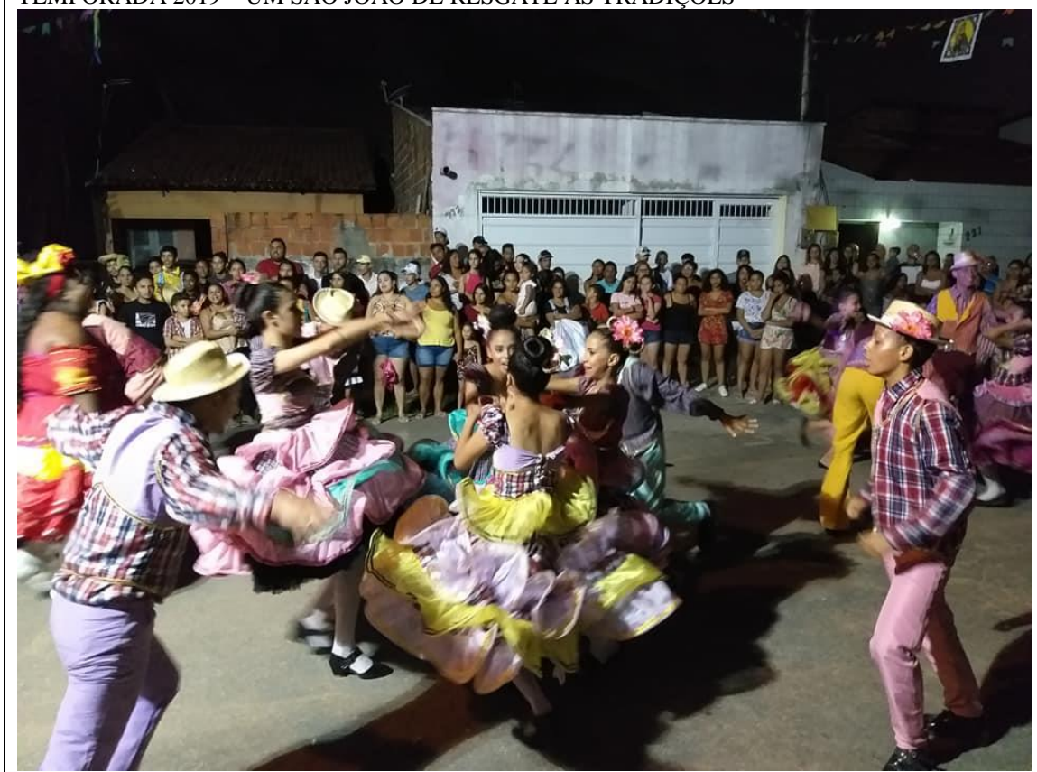
TEMPORADA 2019 – PROJETO UM SÃO JOÃO DE RESGATE AS TRADIÇÕES