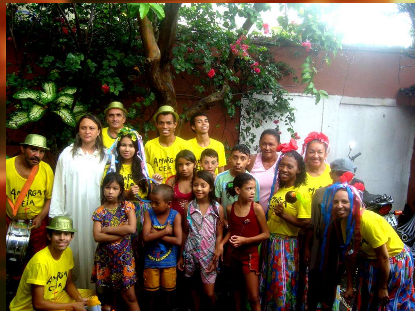
CAPS Comunitário Bom Jardim (Palhoça)

Sendo contemplado com o Edital da Paixão desde o ano 2016, o espetáculo foi apresentado em praças públicas, no TJA e no Hospital Psiquiátrico São Vicente de Paula, agradando ao público e a crítica especializada, o que trouxe autoconfiança para cada integrante do grupo .