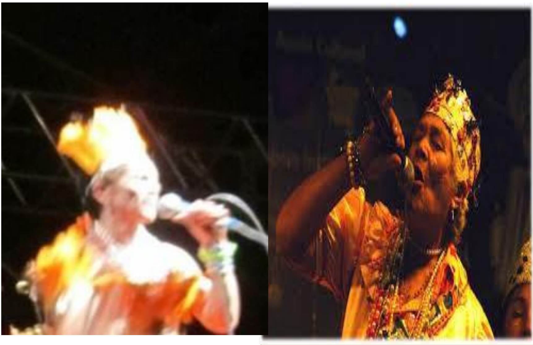
FUI - Festival União da Ibiapaba https://fuiceara.blogspot.com/