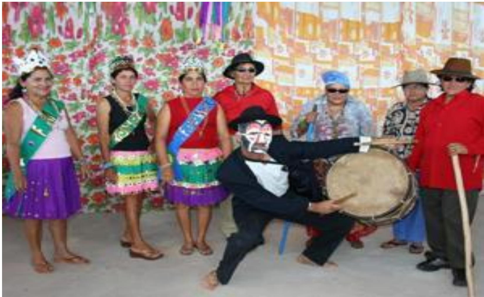
Apresentação na comunidade