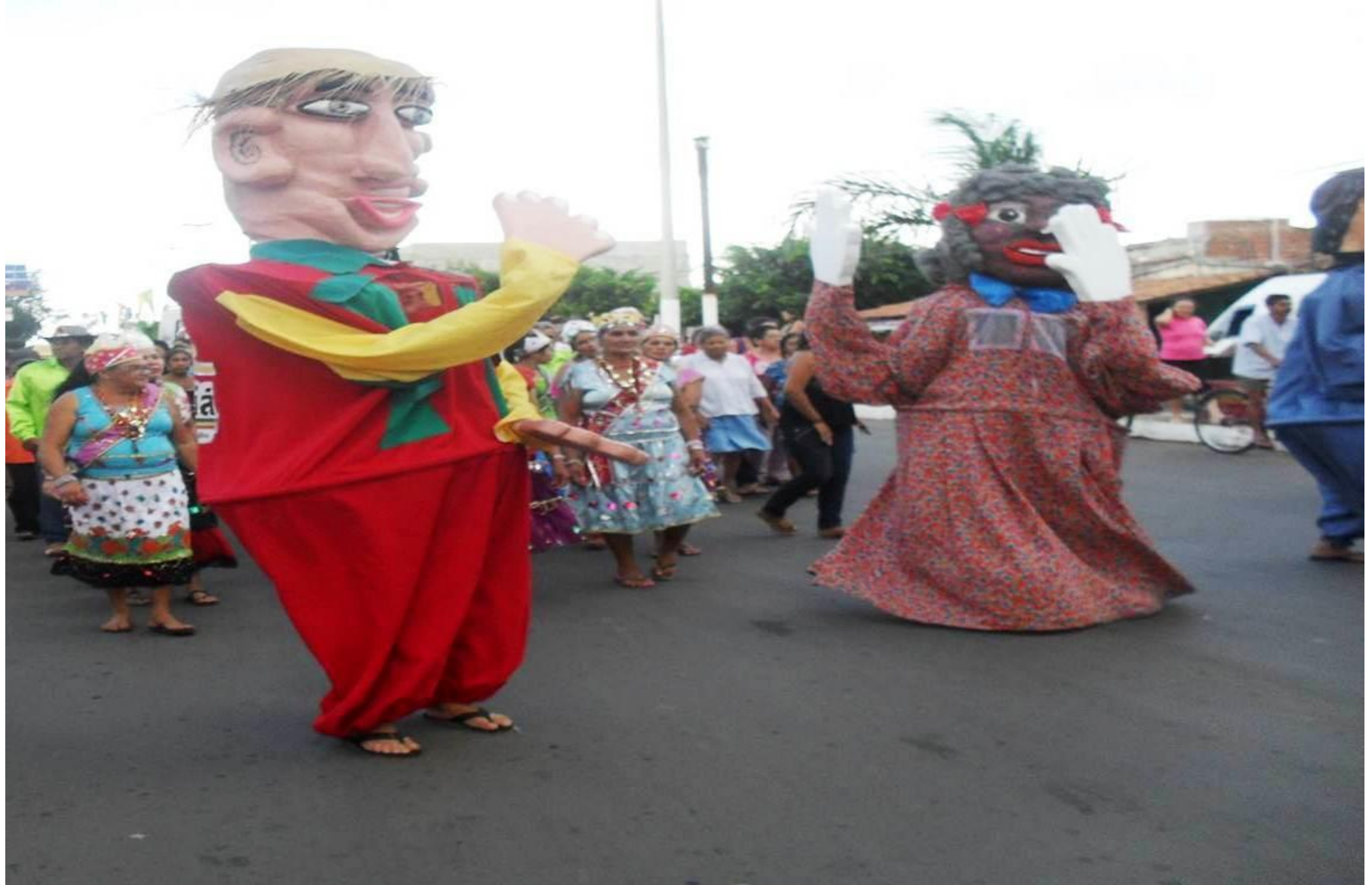
Dramistas no Bloco Lamparina institutolamparina.blogspot.com