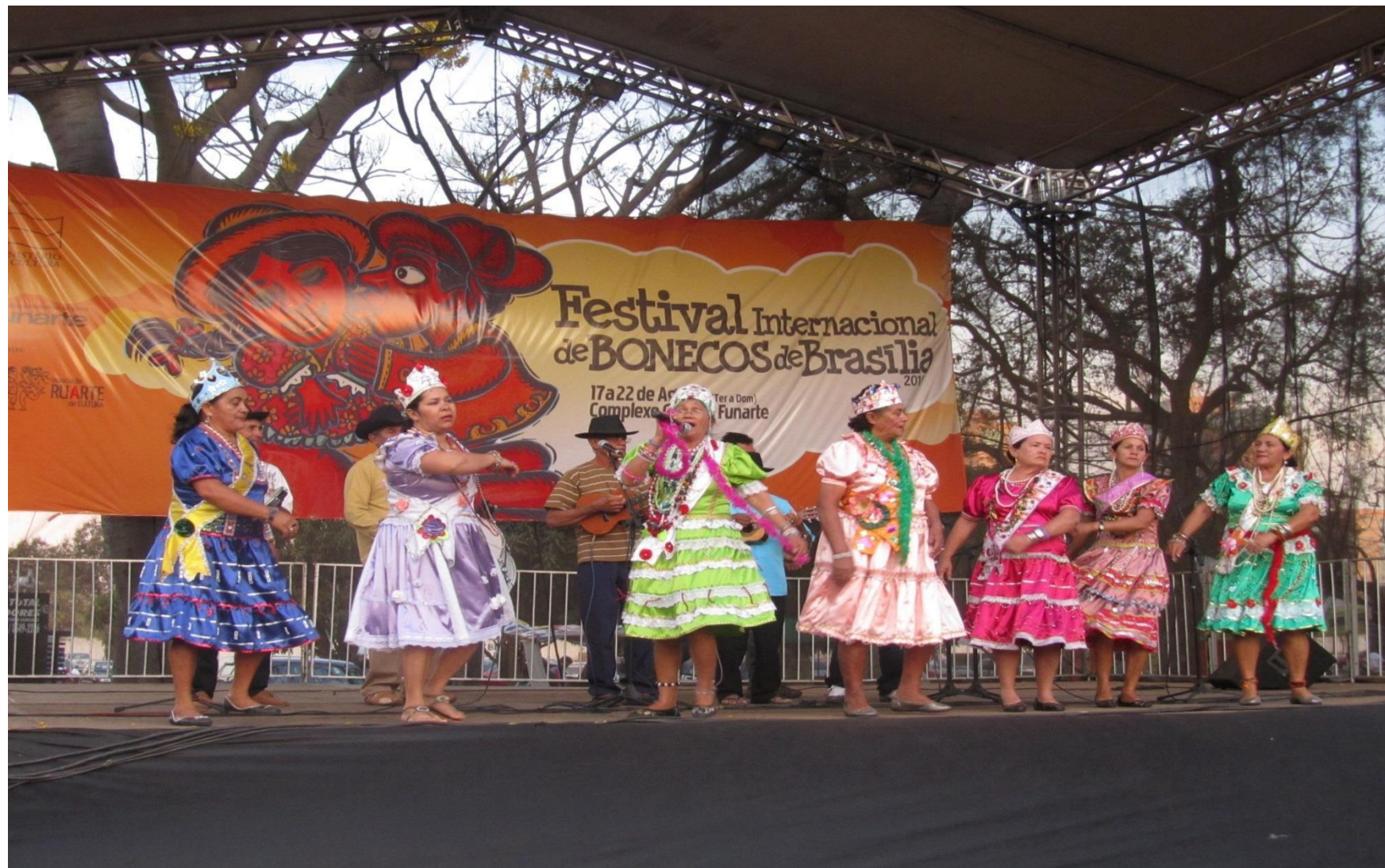
Festival Internacional de Teatro de Brasília http://www.funarte.gov.br/teatro