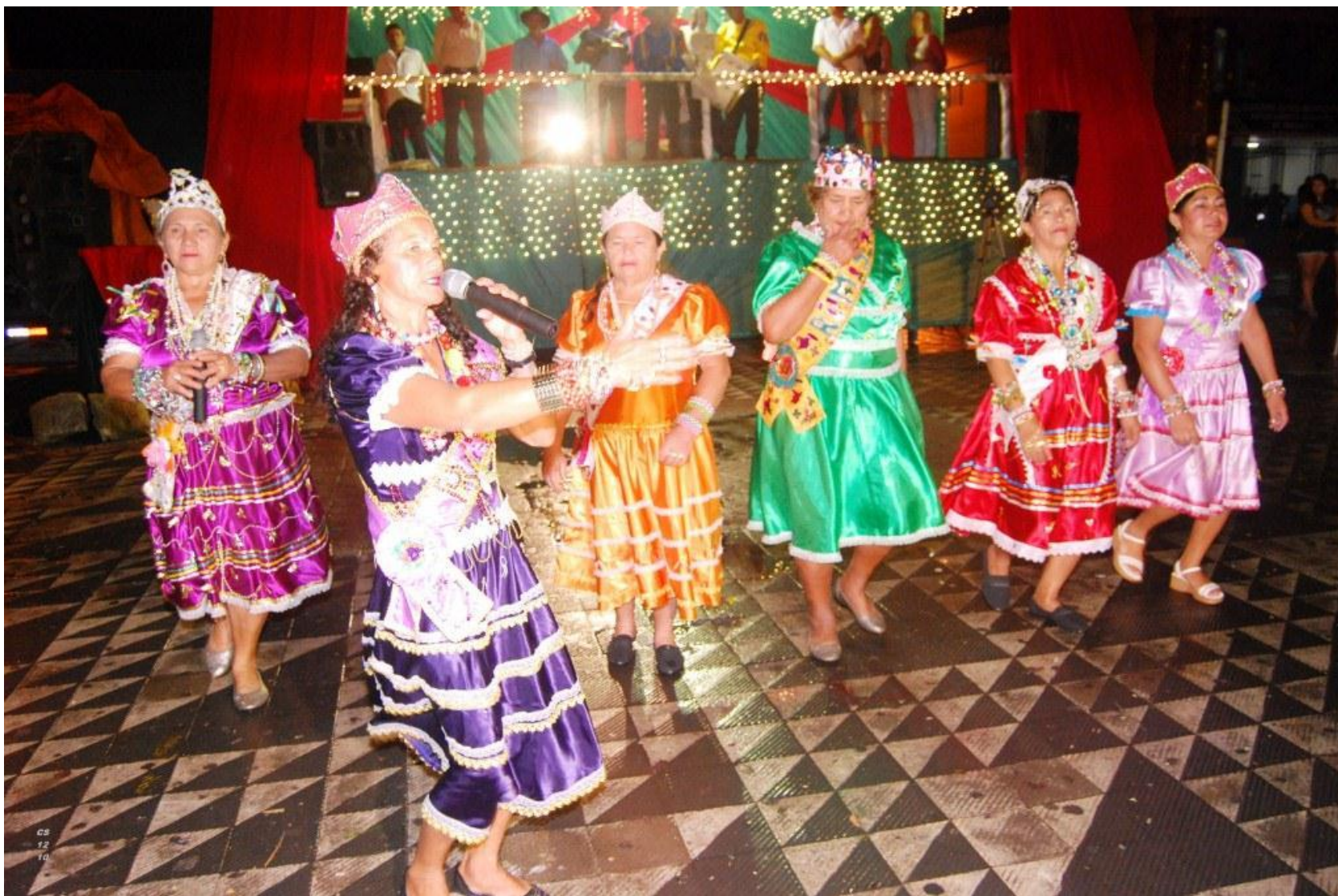
Município de Pires Ferreira -Ceará