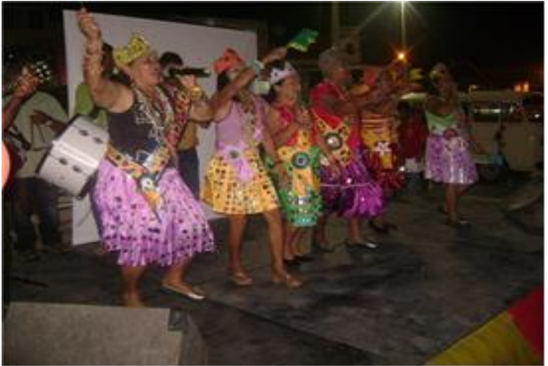
Apresentação em Sobral