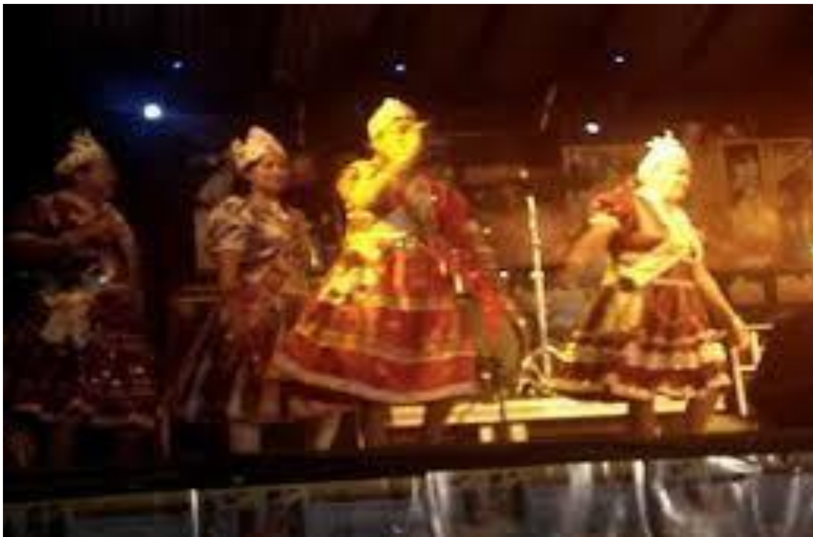
Dragão do Mar – Fortaleza-Ceará fuiceara.blogspot.com