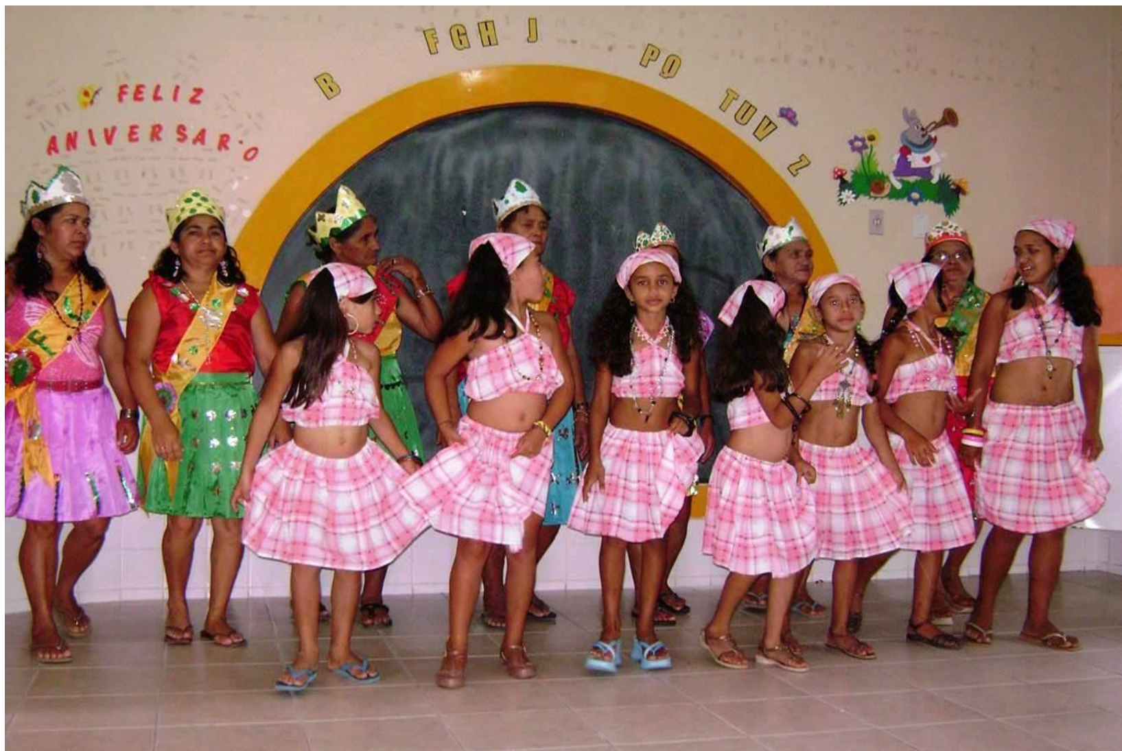
Dramistas Mirins Projeto Arte Cor de Rosa