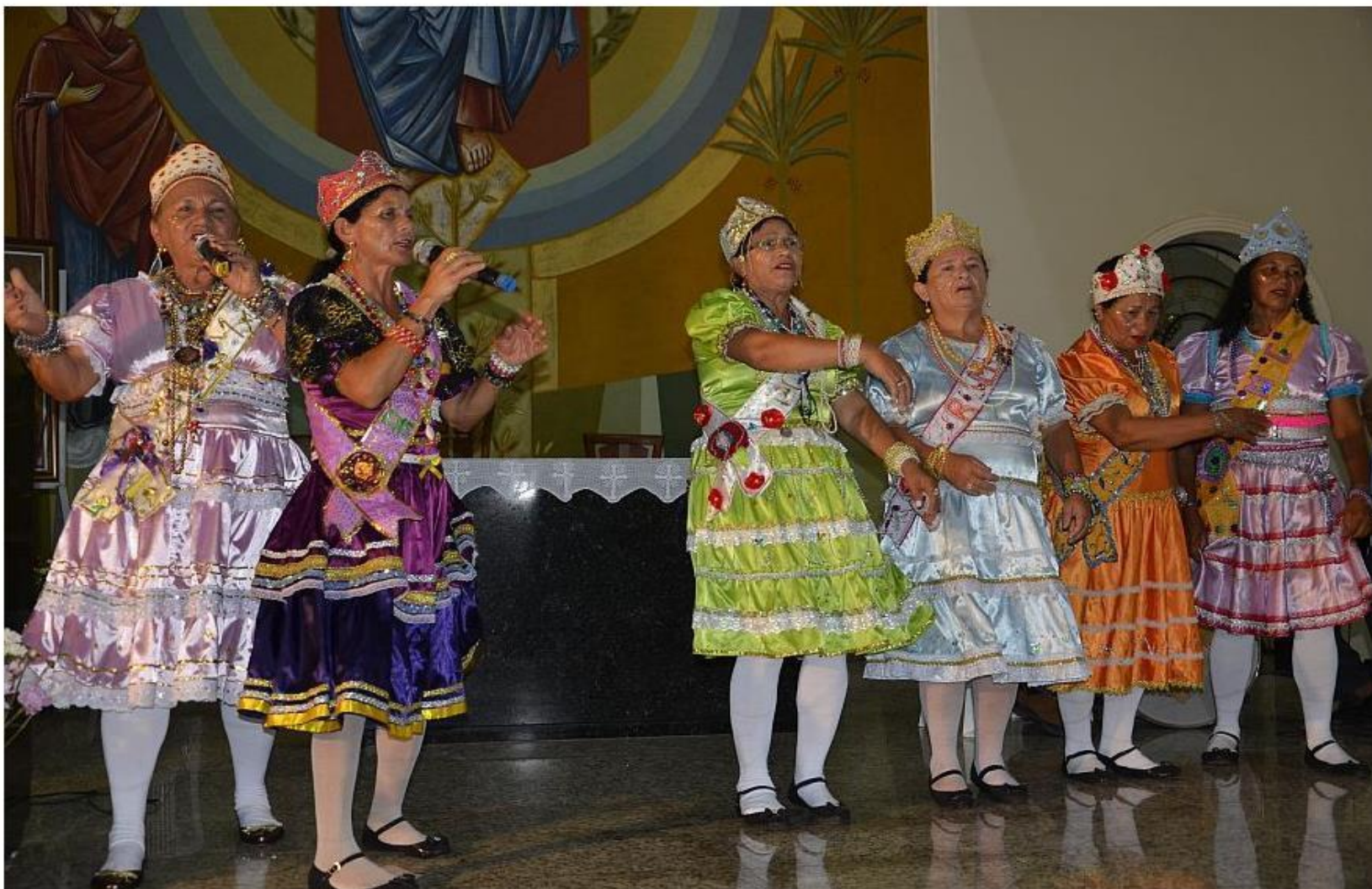
Dramistas dos Tucuns, da cidade de Tianguá-CE, durante apresentação na Igreja Matriz. Image 4 of 15

Monsenhor Tabosa – Ceará http://paginaaberta.com.br/index.php/mt