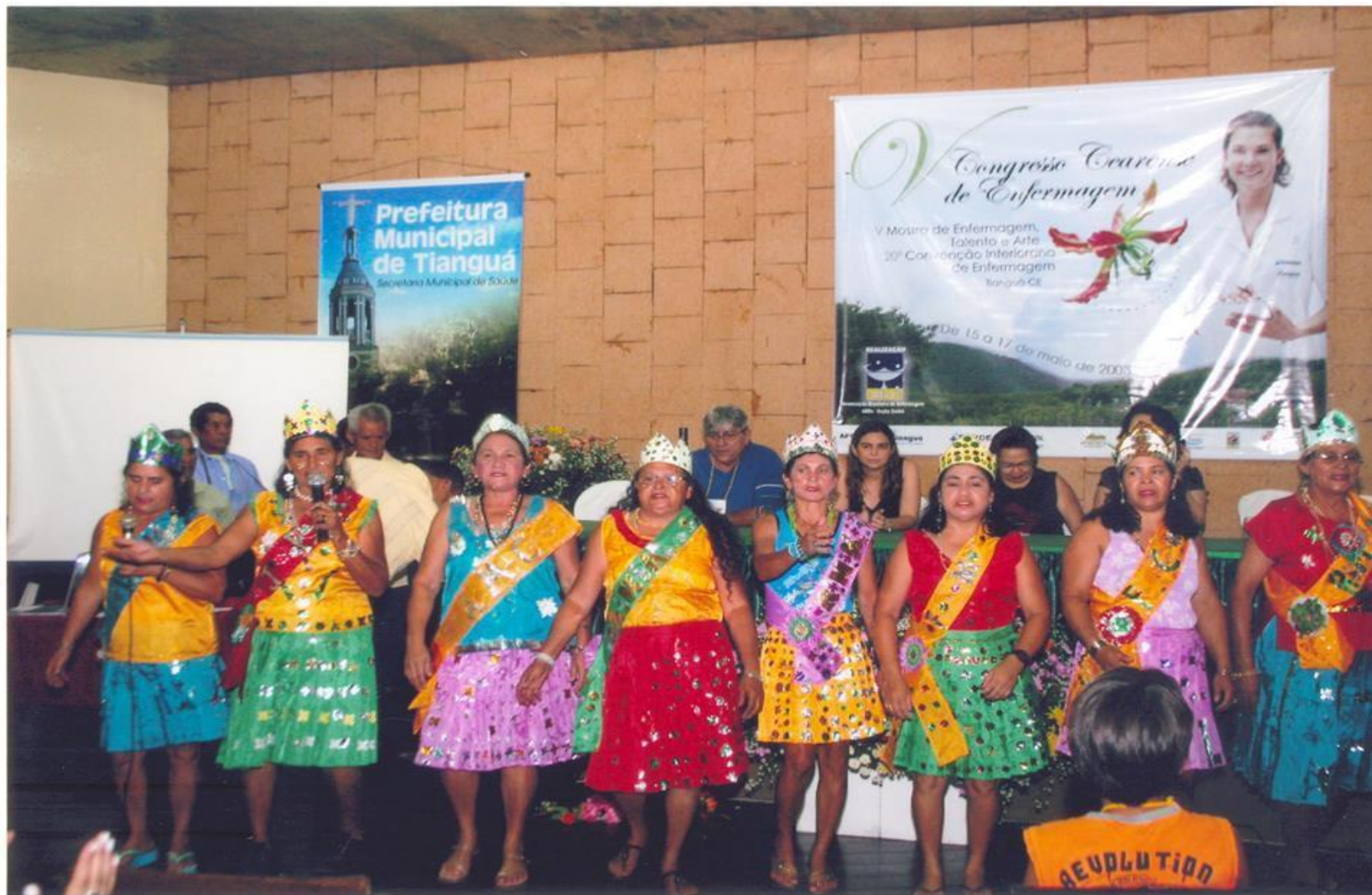
Congresso Estadual de Enfermagem Viçosa do Ceará