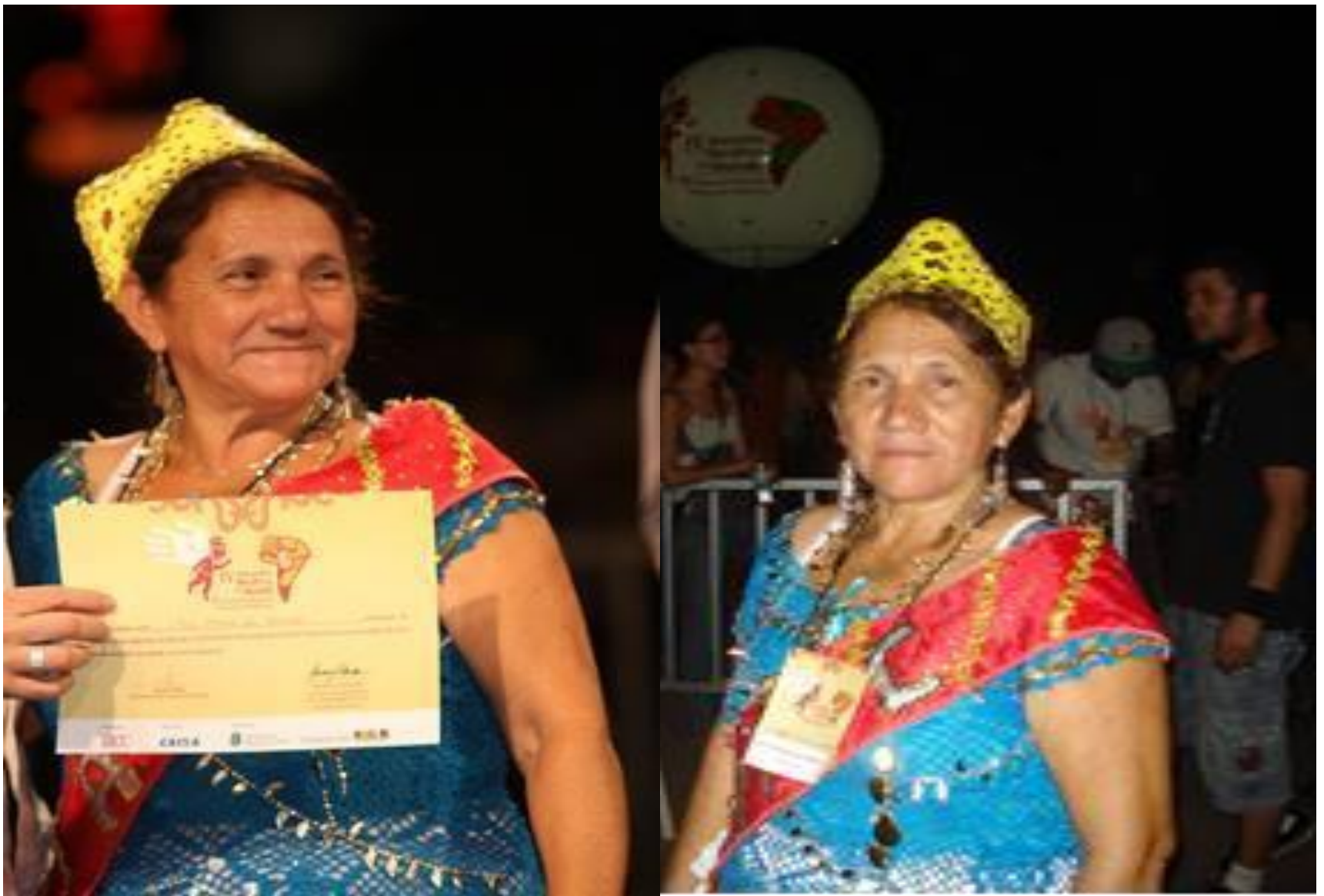
Mestres do Mundo - juazeiro do Norte/Ceará

http://www.secult.ce.gov.br/index.php/patrimonio-cultural/patrimonio-imaterial/mestres-da-cultura/43601