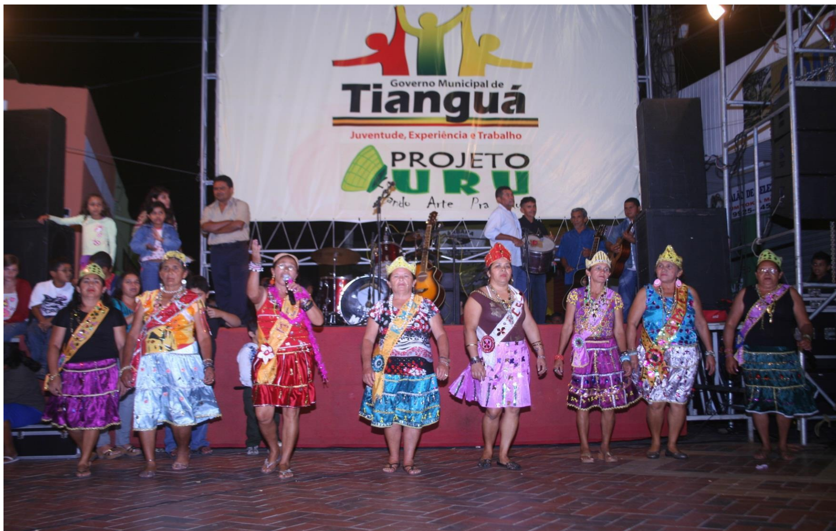
Projeto URU Tianguá-Ceará