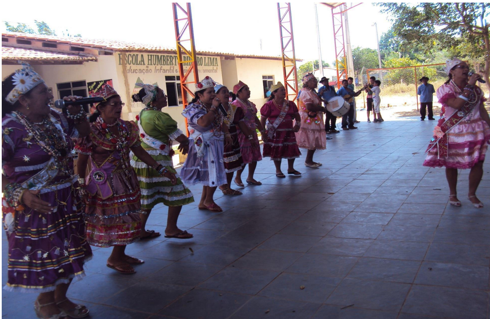
Apresentação em Ibiapina-Ceará