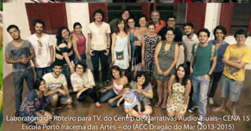
Laboratório de Roteiro para TV, do Centro de Narrativas Audiovisuais - CENA 15 Escola Porto Iracema das Artes - do IACC Dragão do Mar (2013-2015)