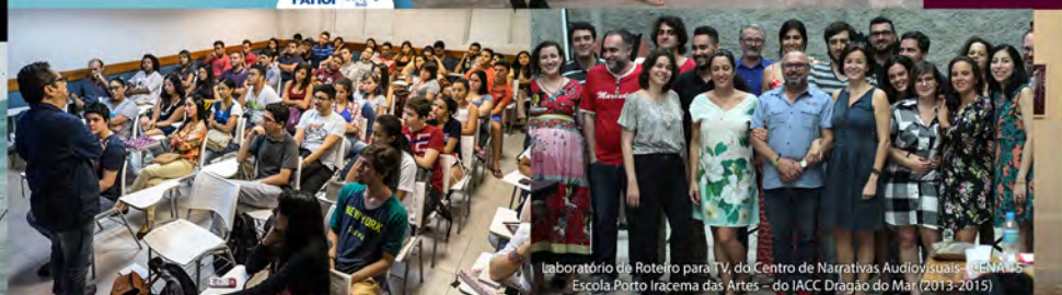
Laboratório de Roteiro para TV, do Centro de Narrativas Audiovisuais - GENAUS Escola Porto Iracema das Artes - do IACC Dragão do Mar (2013-2015)