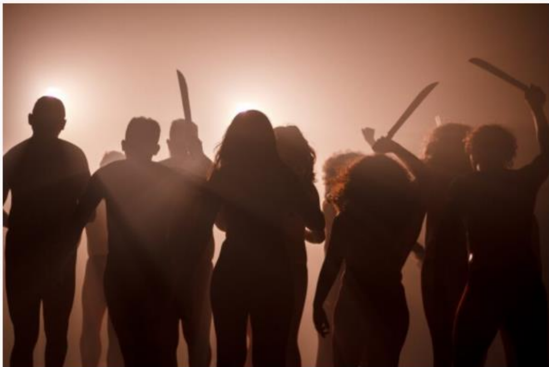
Rainha do Inferno

A montagem é realizada por alunos concludentes do curso de Licenciatura em Teatro do IFCE