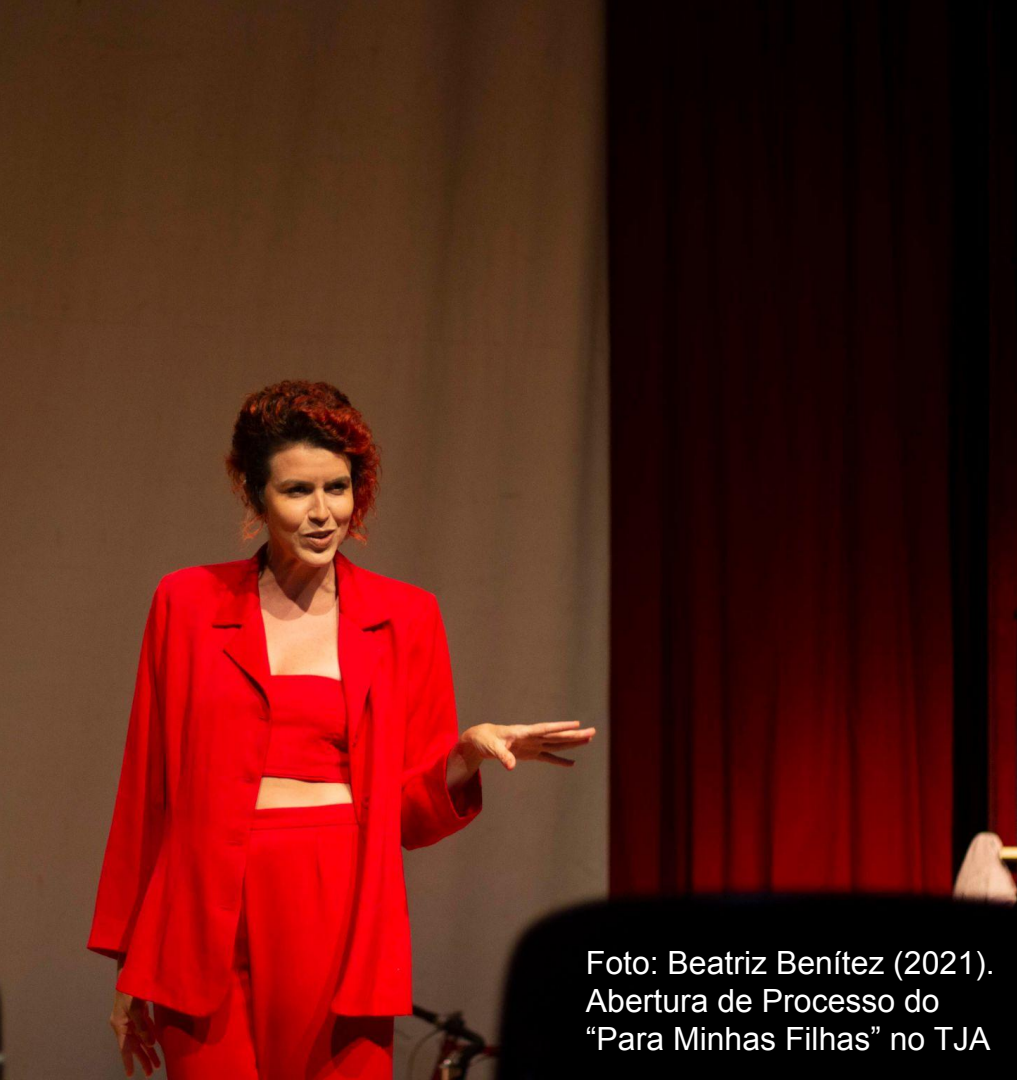
Foto: Beatriz Benítez (2021). Abertura de Processo do “Para Minhas Filhas” no TJA