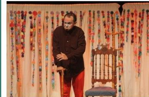
Espectáculo traz releitura da obra de Ariano Suassuna

A apresentação permanecerá em cartaz de sexta-feira (30) a domingo (02), sempre às 19h.