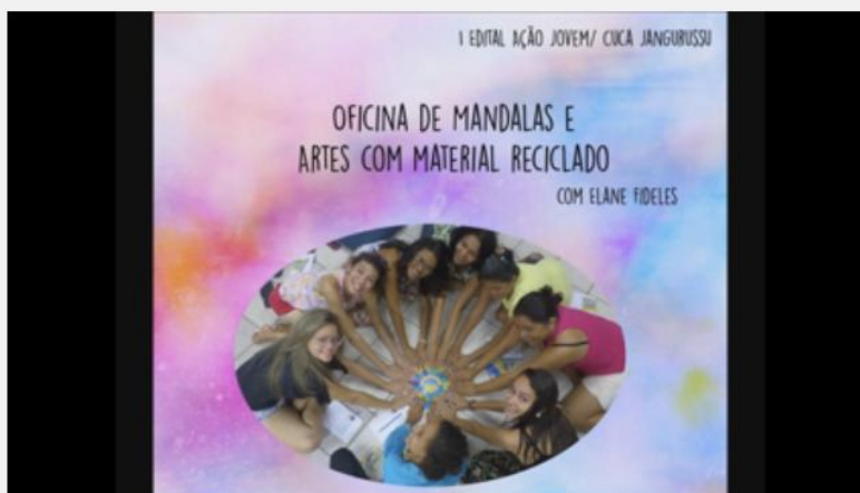
Mandalas e Artes com material Reciclado