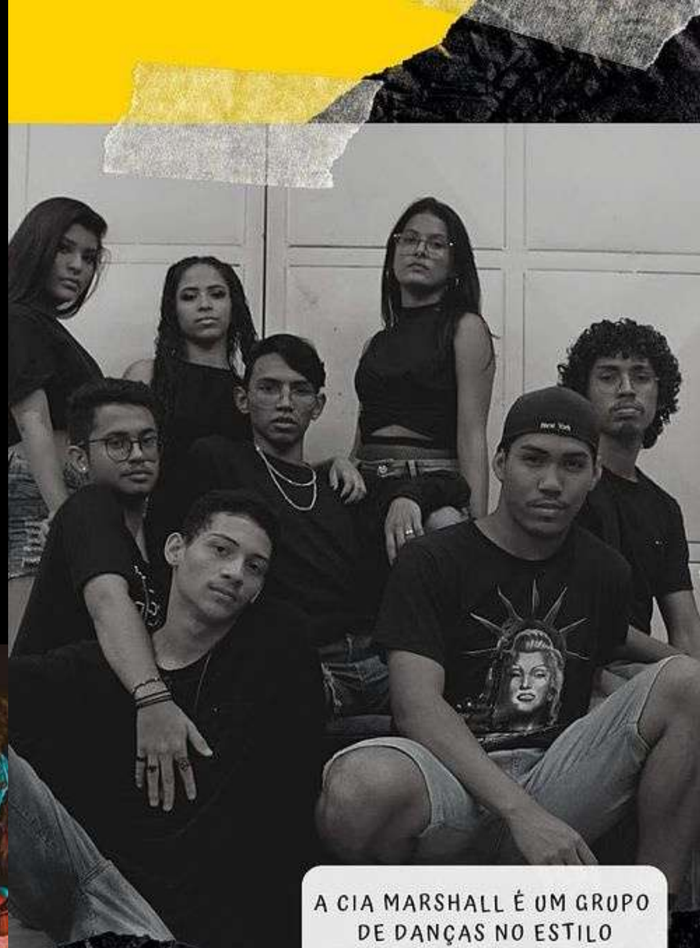
A CIA MARSHALL É UM GRUPO DE DANÇAS NO ESTILO HIP HOP E POP.