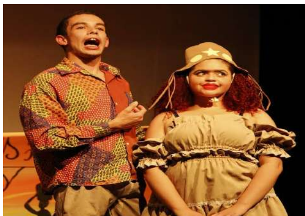
Coordenação de casamento matuto na vila de São João