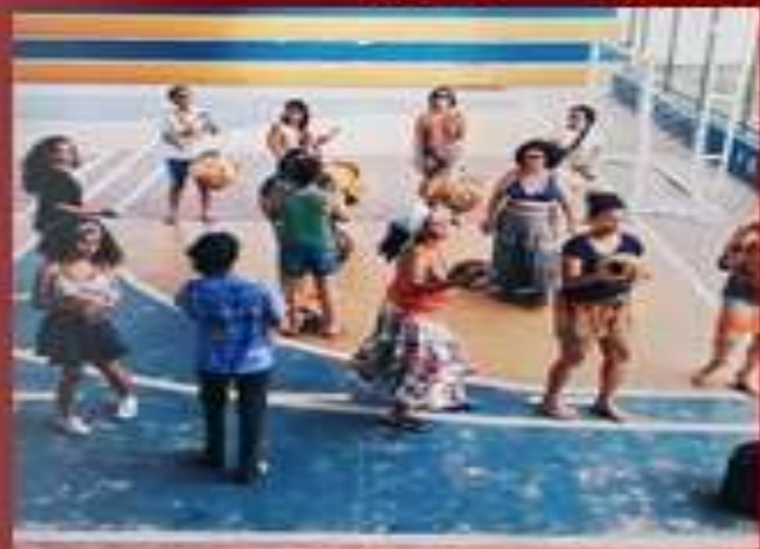
Integrante Baque Mulher Fortaleza