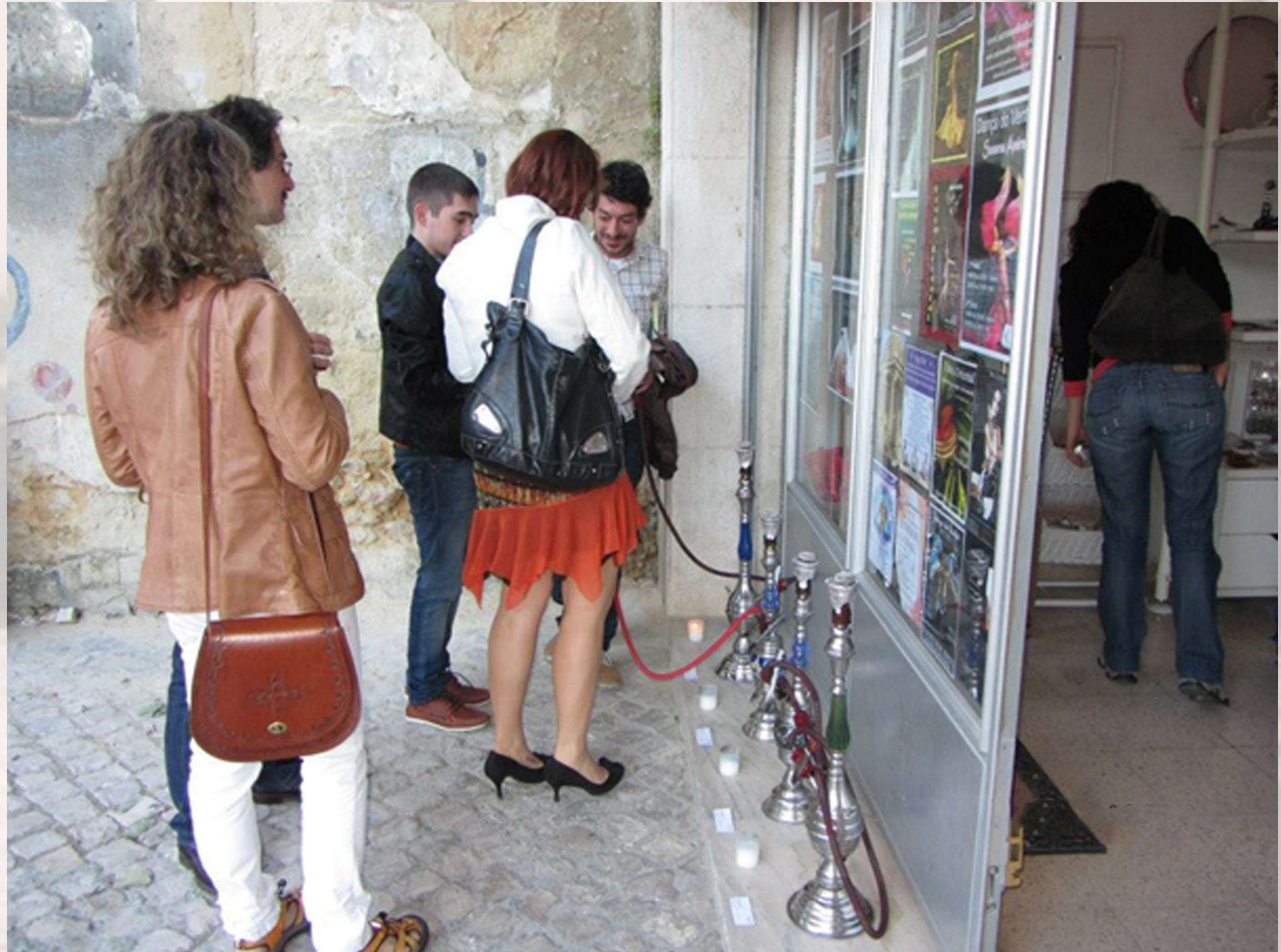
LISBOA/PT - ENTRADA DA EXPOSIÇÃO (NARGUILE) - 2013