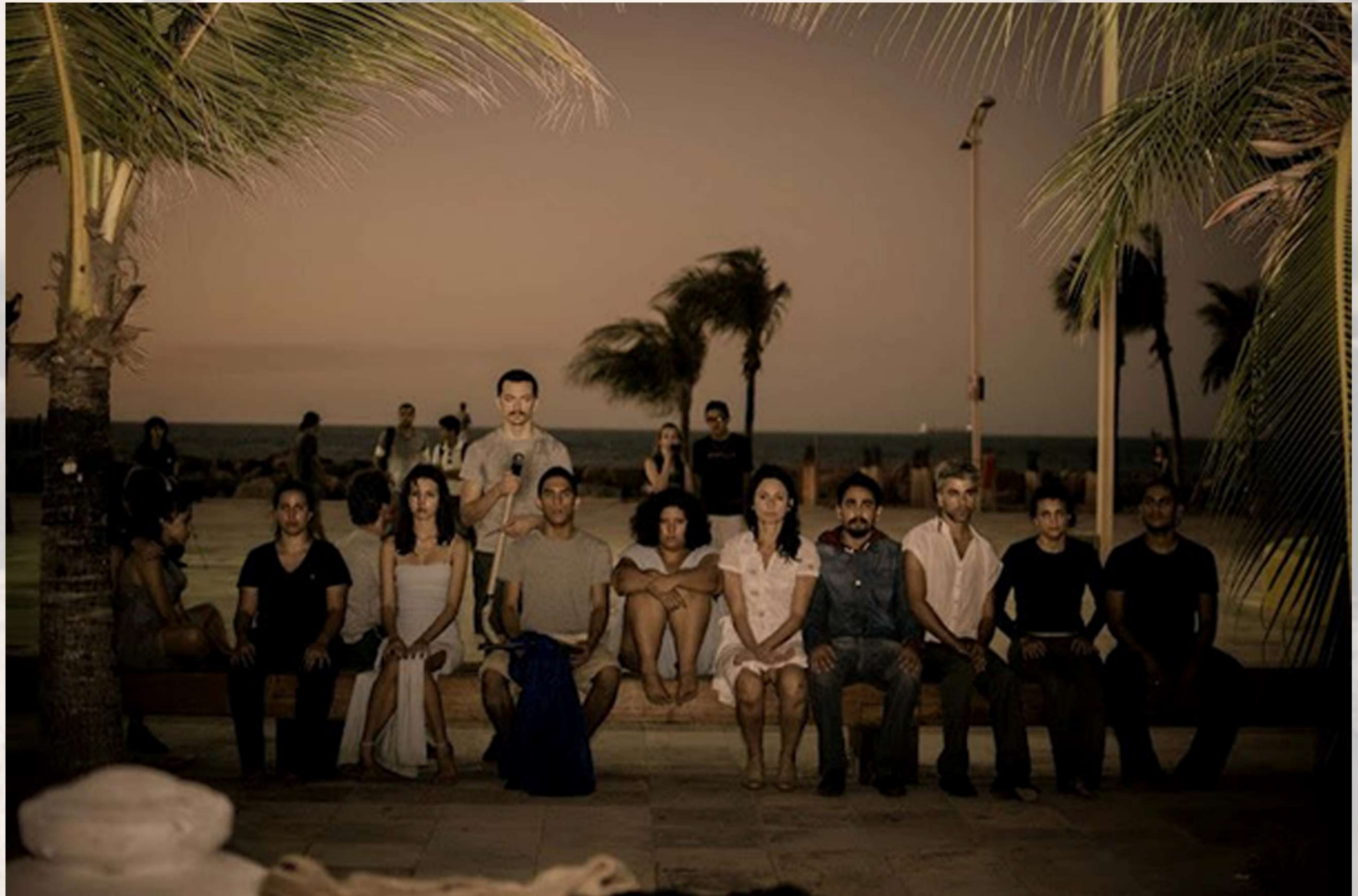
ESTORIL - 26/08 FORTALEZA/CE