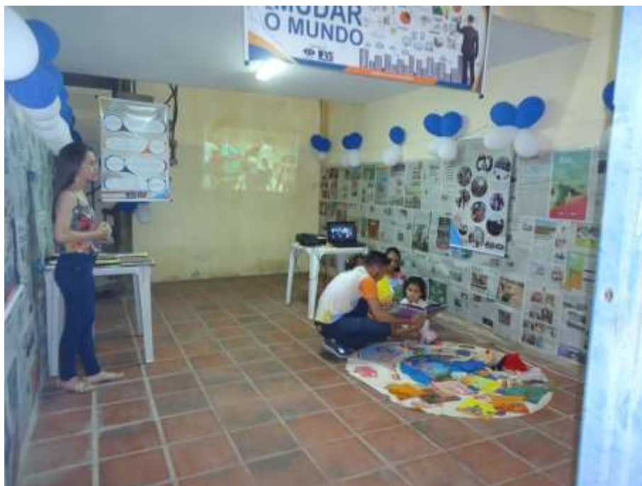
Clube da Leitura, sala destinada aos livros e contação de história – Projeto da então Faculdade Vale do Salgado (FVS), hoje Centro Universitário Vale do Salgado (UniVS)

ASSOCIAÇÃO FILHOS E AMIGOS DE ICÓ – AMICÓ CNPJ: 12.334.760/0001-14 FUNDADA EM 14 DE JULHO DE 2010