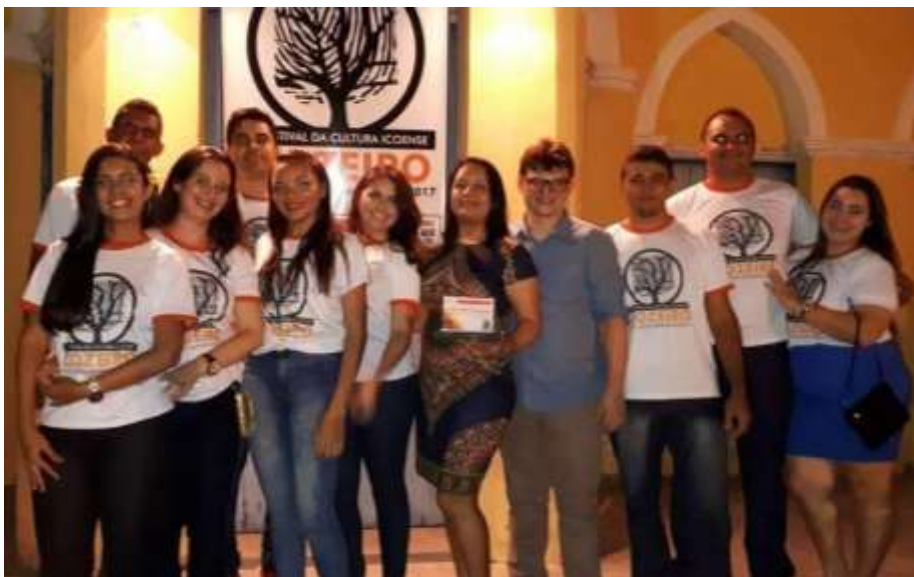
Entrega da Placa Especial do Festival Icozeiro à UFCA – IESA, em 2017

(Hemoce) – Regional de Iguatu foram agraciadas com estas homenagens especiais que visam reforçar a construção coletiva de um evento que visa carregar consigo a Cultura, Educação e o Social.