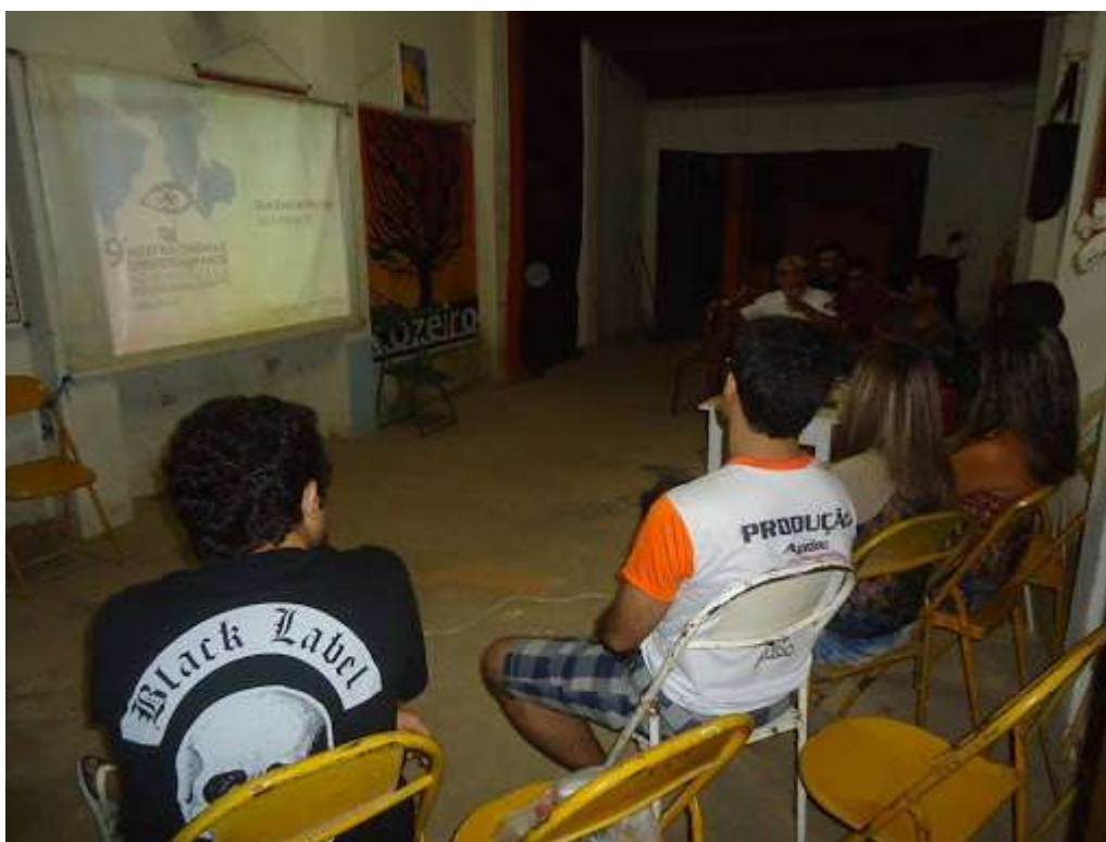
Exibição ocorrida na Sala Poeta José de Oliveira Neto, durante a 9ª Mostra Cinema e Direitos Humanos na América Latina, em 2015

Este projeto audiovisual já foi contemplado com a 9ª Mostra Cinema e Direitos Humanos na América Latina (2015), 10ª Mostra Cinema e Direitos Humanos no Mundo (2016) e 11ª Mostra Cinema e Direitos Humanos (2017), ambos do Governo Federal; Mostra do Filme Livre (MFL) em 2015 e 2016 e projeto “Última Sessão” (2015). As exibições foram realizadas na Sala Poeta José de Oliveira Neto, escolas públicas estaduais e no Festival ICOZEIRO. As exibições aconteceram de forma regular até o ano de 2018, descontinuado por problemas ocorridos no aparelho datashow de exibição, mantendo, contudo, rico acervo para retomada das exibições.