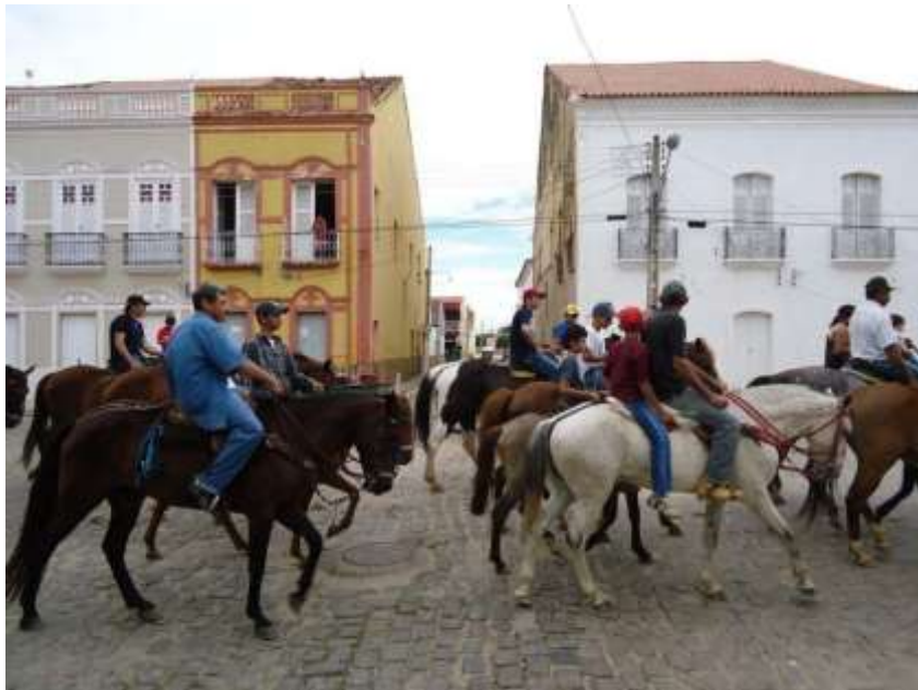
Dia do Vaqueiro Icoense em edições recentes, em registro na Rua Ilídio Sampaio ("Rua Grande"), Centro Histórico do Icó-Ceará

A estratégica localização do Icó, com área fronteira entre Rio Grande do Norte e Paraíba e às margens do Rio Salgado facilitaram o crescimento da "Princesa dos Sertões". E um dos principais motores foi o vaqueiro, com a lida diária do rebanho bovino.