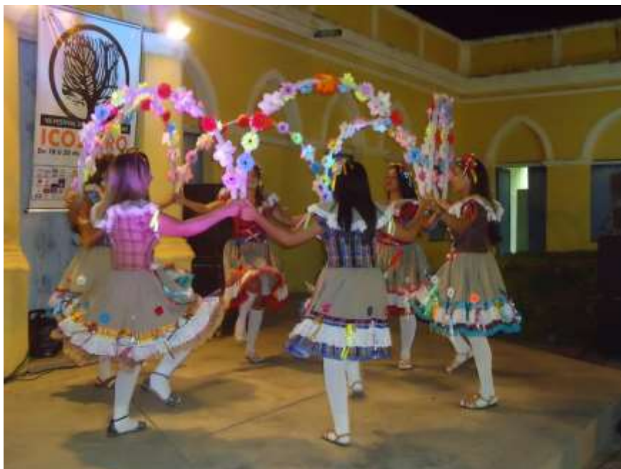
Apresentação do grupo regional de Tradição Maria Bonita, de Umari-CE

Dentro deste período de uma densa amostra artística, acontece a denominada “Virada Cultural”, quando a programação se estende pela noite, adentrando a madrugada no espaço do Centro de Arte e Cultura (antiga Casa de Câmara e Cadeia), na área do pátio externo. Iniciada no ano de 2012, essa ação visa possibilitar a reflexão e ação sobre a ocupação do espaço público em horários diferenciados. São realizadas participações agendadas e espontâneas. Nos anos de 2018 e 2019, a Virada Cultural adentrou o Largo do Théberge, mantendo a proposta e o alerta para a necessidade da contínua ocupação do espaço público, histórico e tombado, com ações artísticas para a população local, de forma a ressaltar não apenas a ocupação, mas o porquê dela, com vistas a reforçar o sentimento de pertencimento ao espaço pela comunidade e promover o diálogo com o Largo do Théberge, onde está localizada a principal praça e o marco zero do município icoense.