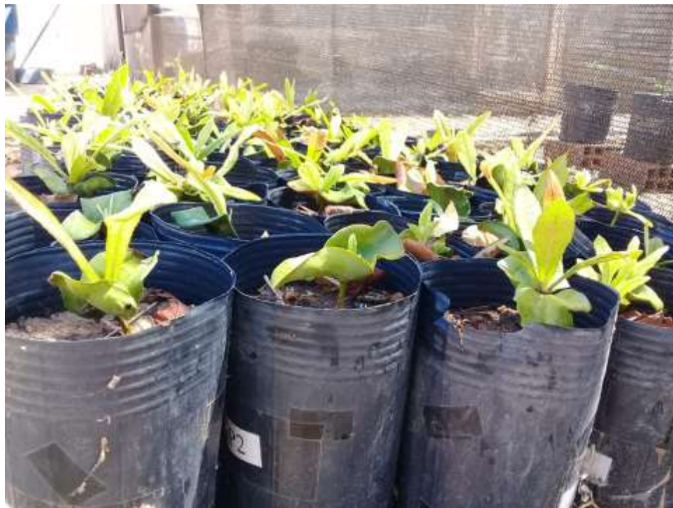
Mudas do Icozeiro recebidas por doação em 2019

O IFPB, através deles, realizou todo o processo de produção de sementeiras e acompanhamento. Além deles, houve parceria com a Secretaria do Desenvolvimento Agrário (SDA) do Governo do Estado do Ceará, que possibilitou o traslado das mudas da Paraíba ao Ceará, possibilitando a entrega do Icozeiro ao Icó.