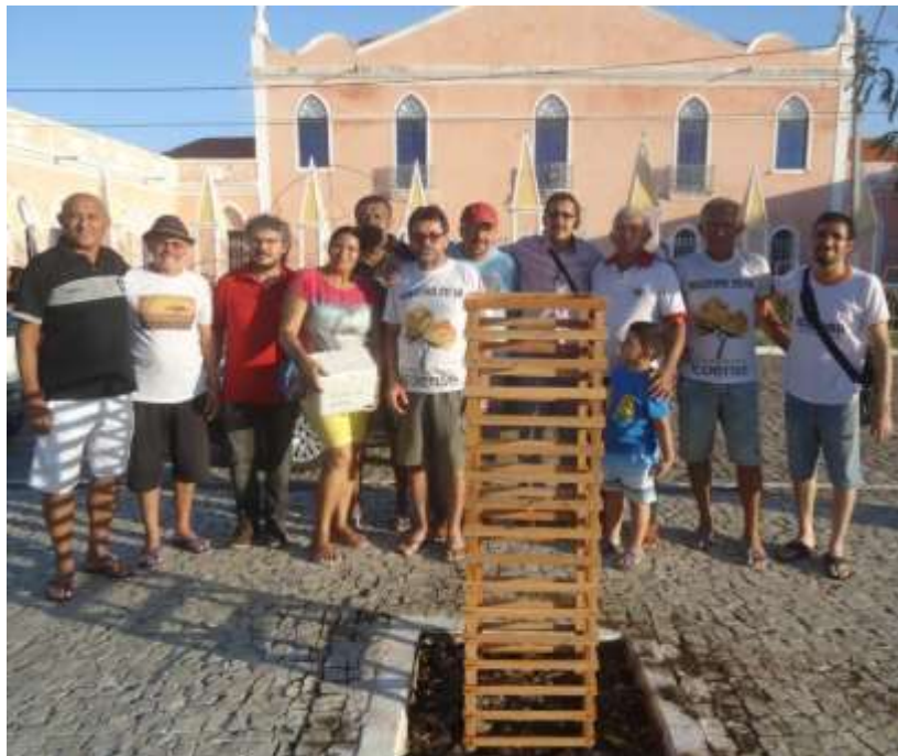
Equipe de repatriação e plantio da planta Icozeiro, em 2017, Largo do Théberge, Icó-CE

A representatividade do ato diz respeito a planta que há séculos se encontrava ausente do território icoense e que, conforme a historiografia, teria dado origem ao nome “Icó”, que de povoado tornou-se vila e cidade, através do Ciclo do Gado e do Milho e Algodão. A planta teria sido dizimada em virtude da sua toxicidade aos solípedes, especialmente o gado, que morria ao consumi-la.