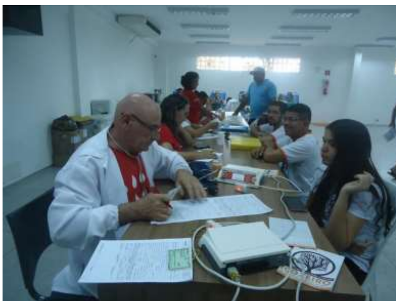
Coleta externa de sangue realizada em parceria pelo Hemoce em 2017

Ao longo das edições ocorridas em quase todas as edições, mais de 400 bolsas de sangue foram coletadas, além de cerca de 150 cadastros de medula óssea. A ação é realizada na então Faculdade Vale do Salgado (FVS), em sistema de parceria, por oferecer estrutura adequada para a ação social. A exceção deste caso aconteceu na primeira edição, quando aconteceu na antiga Casa de Câmara e Cadeia de Icó