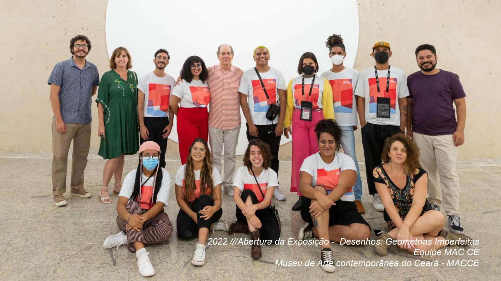
2022 /// Abertura da Exposição - Desenhos: Geometrias Imperfeitas Equipe MAC CE Museu de Arte contemporânea do Ceará - MACCE