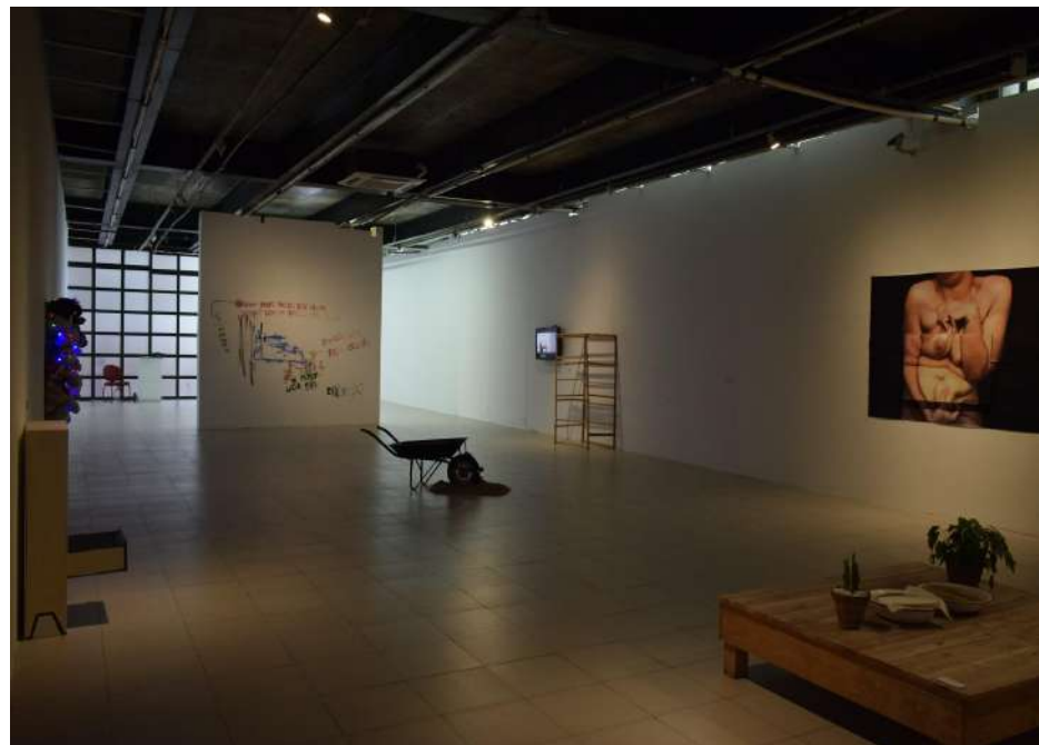
2018 /// Cartografias de Si /// Centro Cultural Banco do Nordeste - CCBNB /// Fortaleza/CE